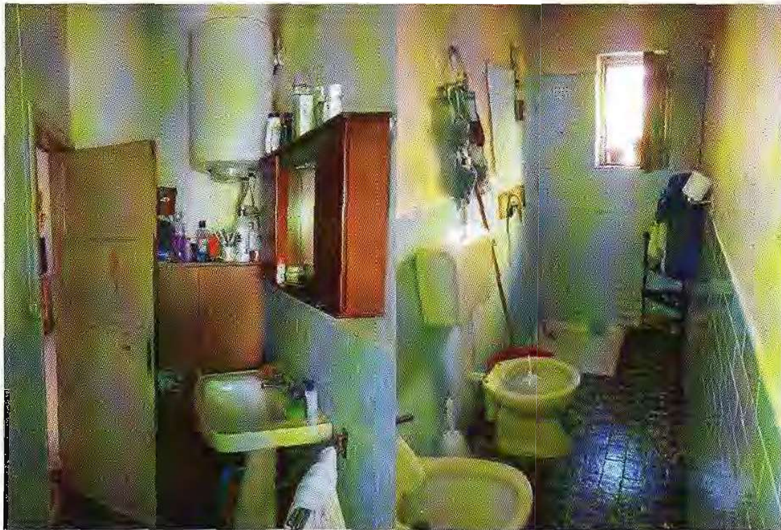
Foto n° 18 -Servizio igienico - piano 2° Foto n° 19 -Servizio igienico - piano 2°