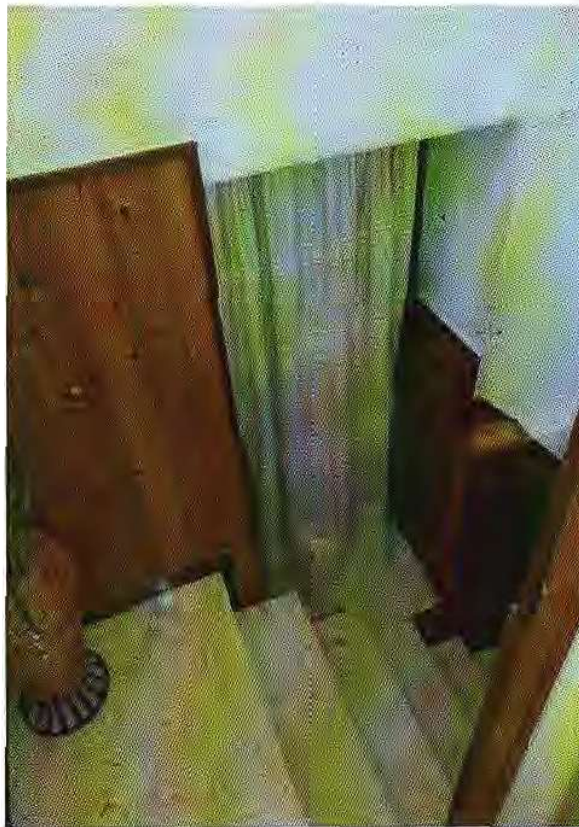
Foto n° 14 -Accesso camera letto piano ammezzato tra il piano 1°e 2°