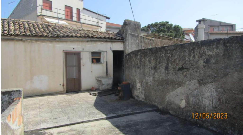
Fotografia nr. 18