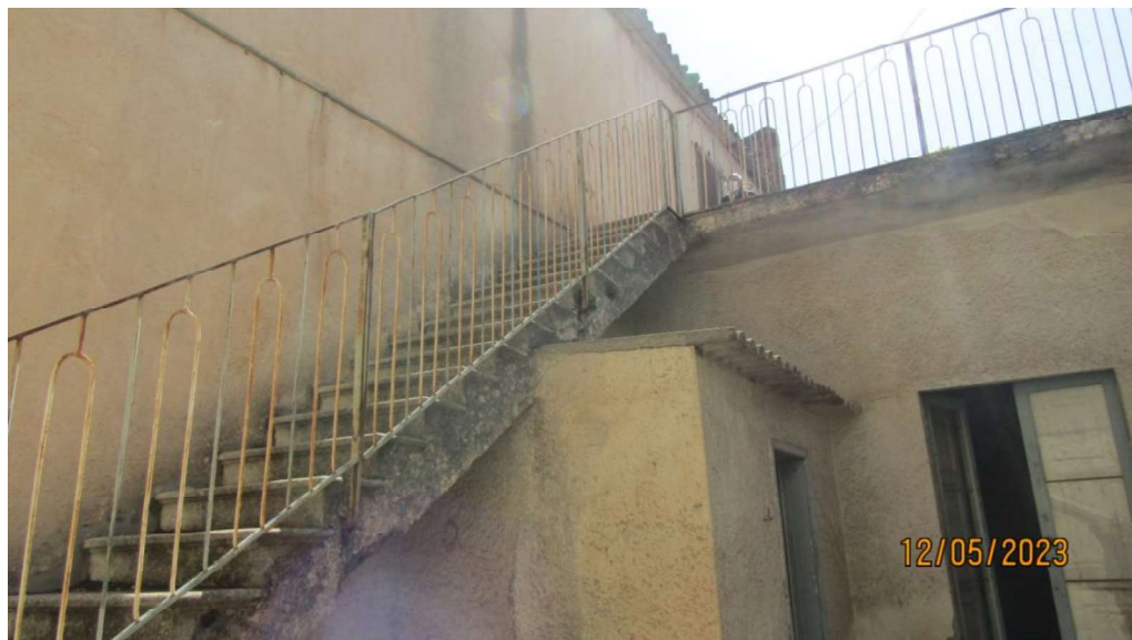
Fotografia nr. 14