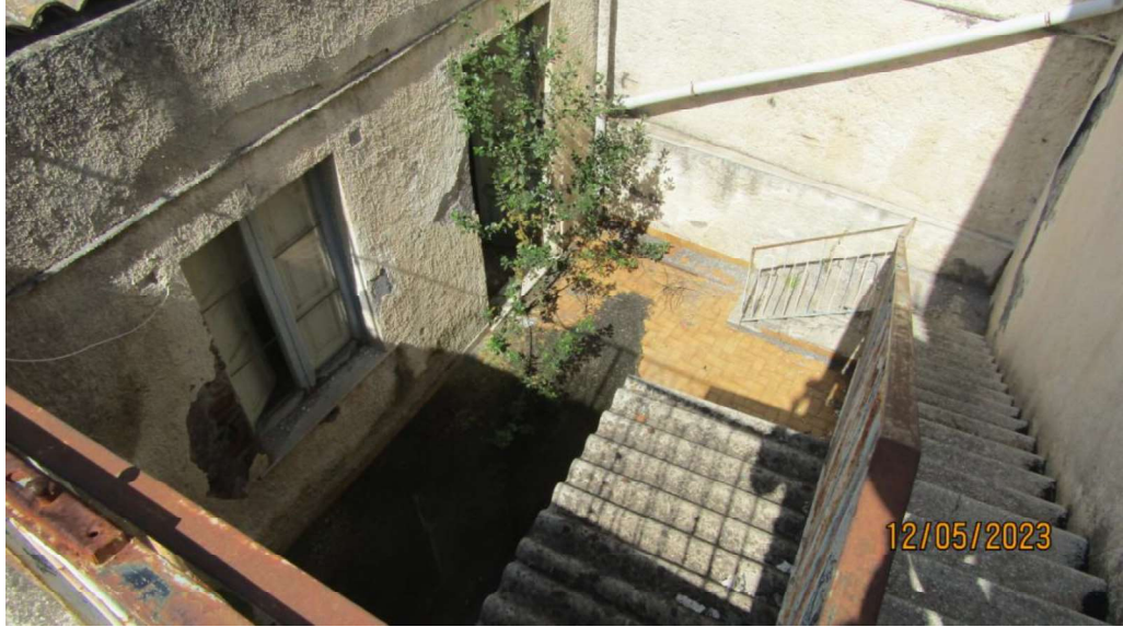
Fotografia nr. 16