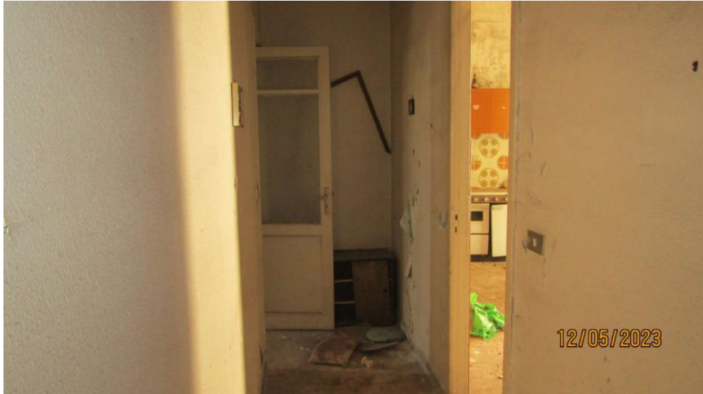
Fotografia nr. 8