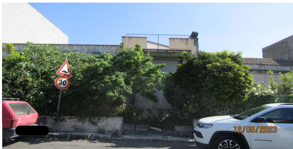
Fotografia nr. 1

Appartamento – p.lla nr. 30, f. nr. 32, sub. 5