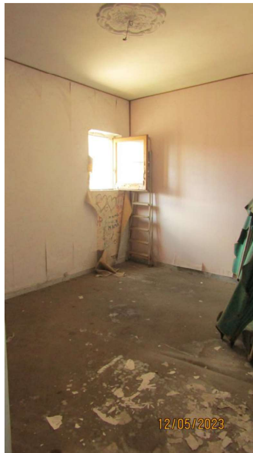
Fotografia nr. 21