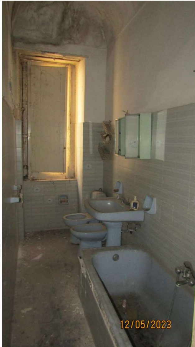
Fotografia nr. 7