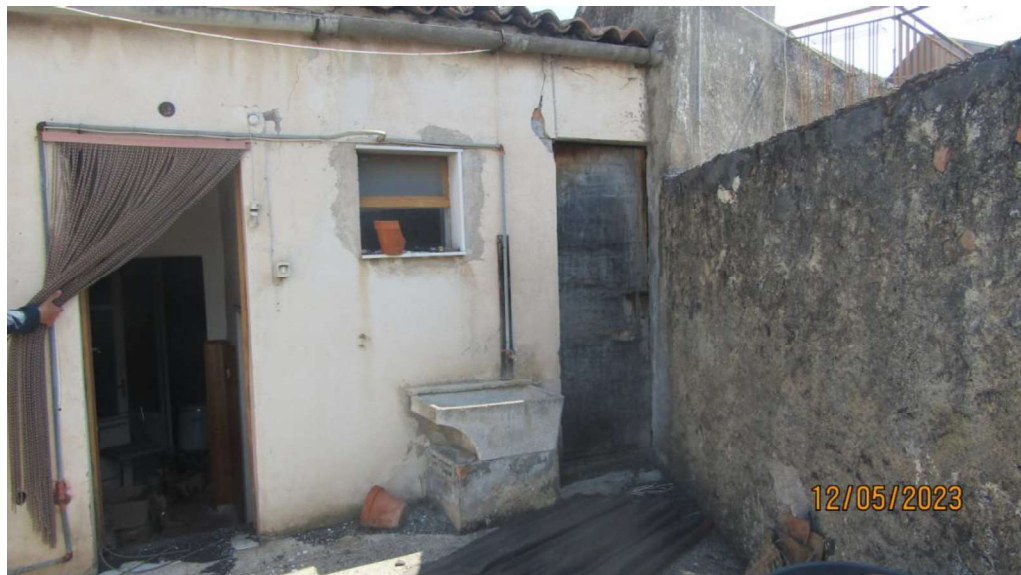
Fotografia nr. 23