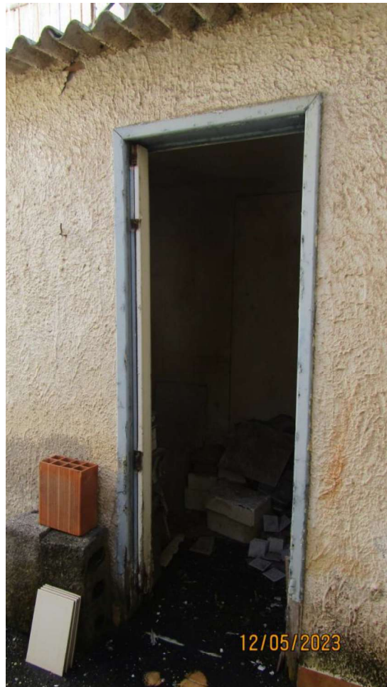
Fotografia nr. 13