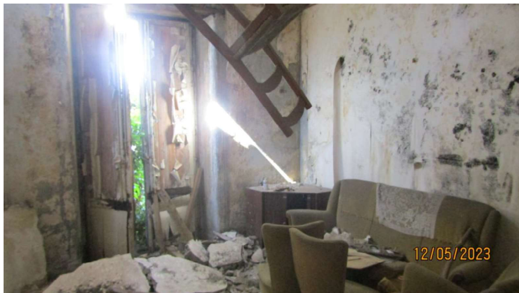
Fotografia nr. 3