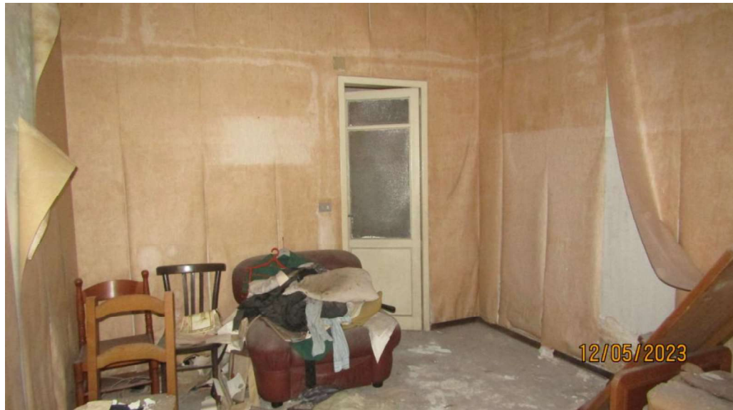
Fotografia nr. 6