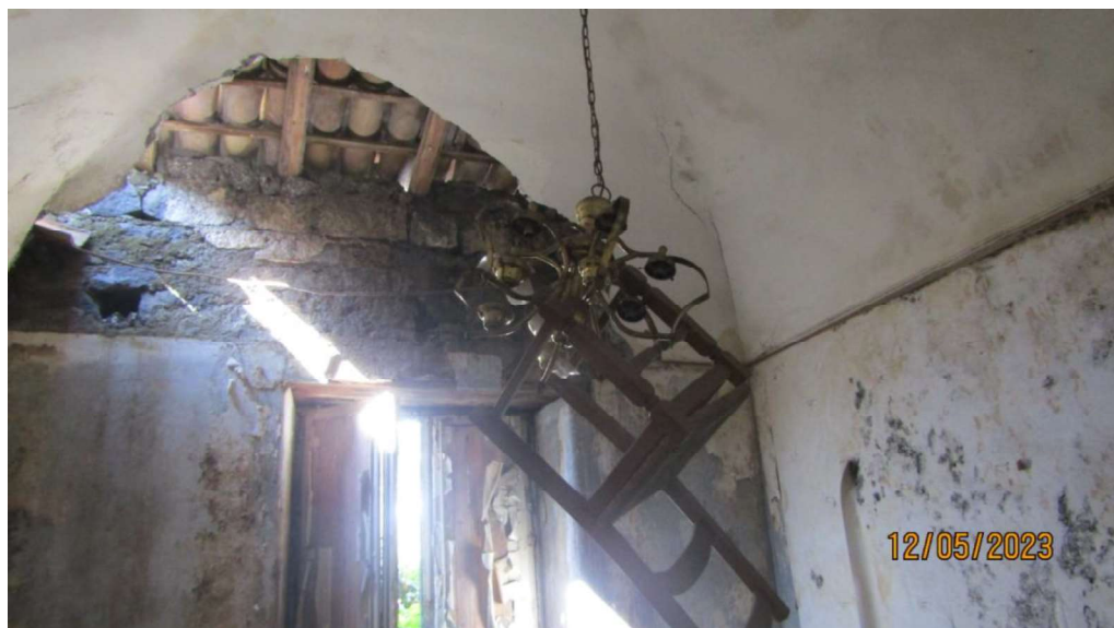
Fotografia nr. 4