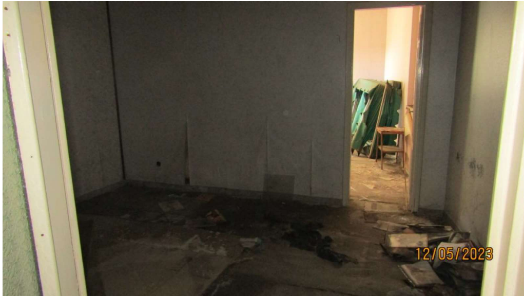
Fotografia nr. 20