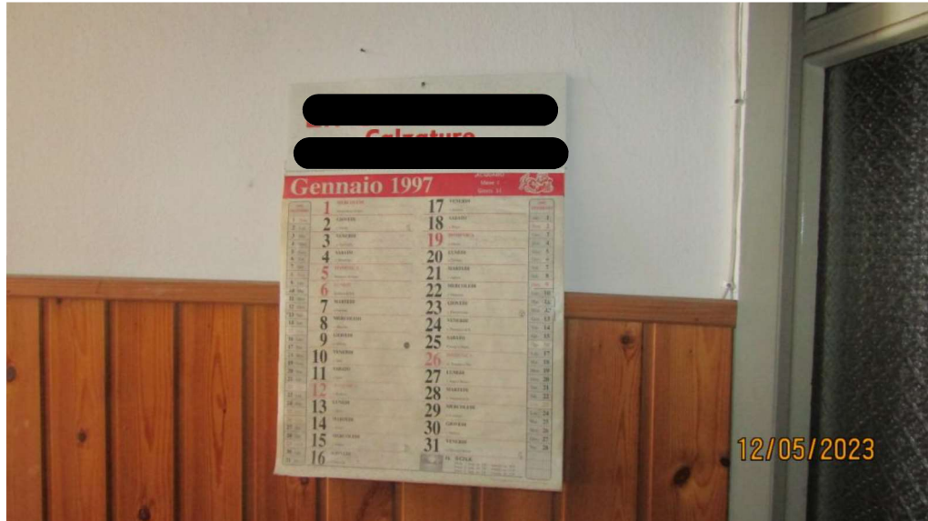
Fotografia nr. 22