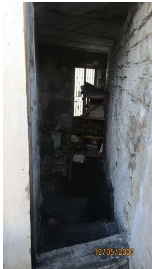
Fotografia nr. 19