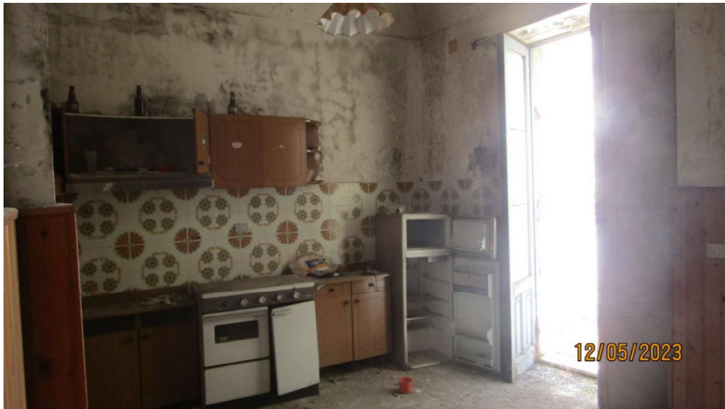
Fotografia nr. 9