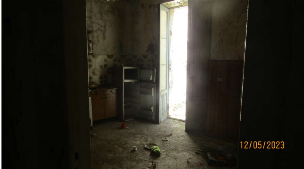
Fotografia nr. 10