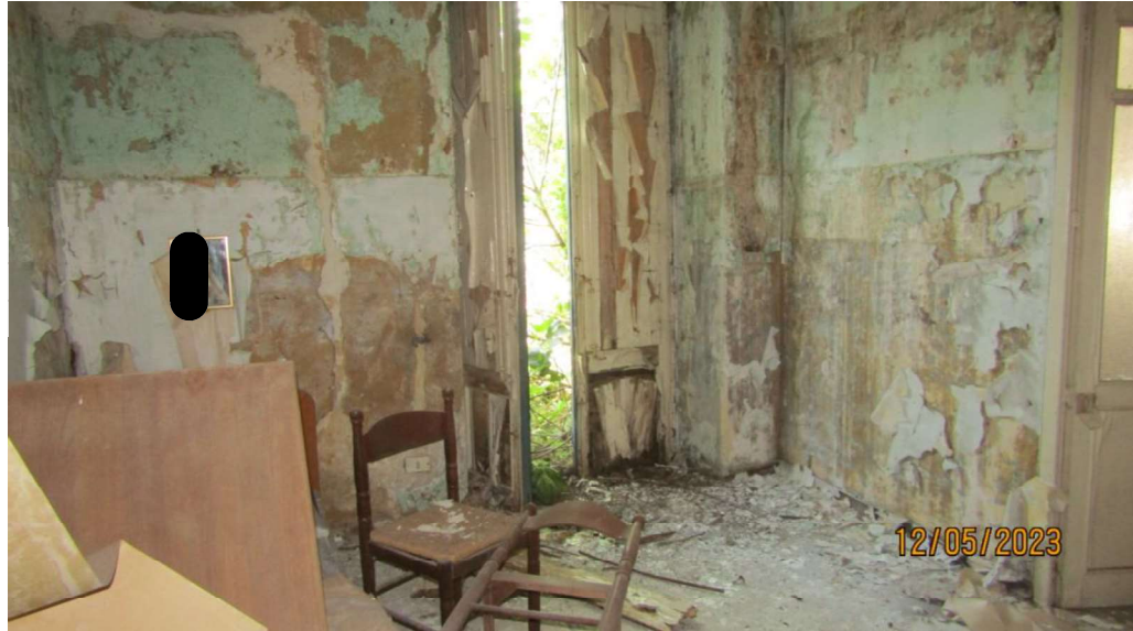
Fotografia nr. 5