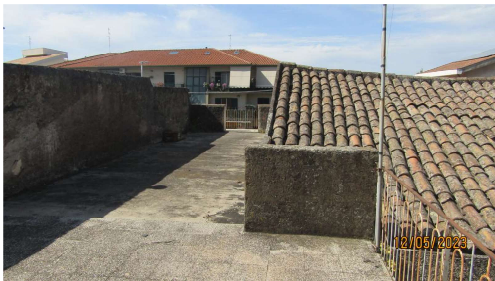
Fotografia nr. 15