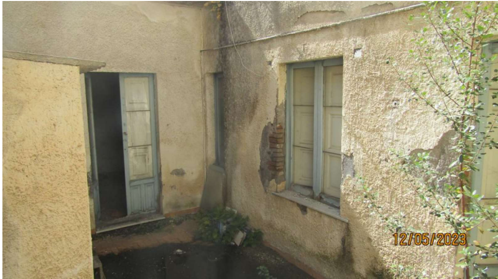
Fotografia nr. 12