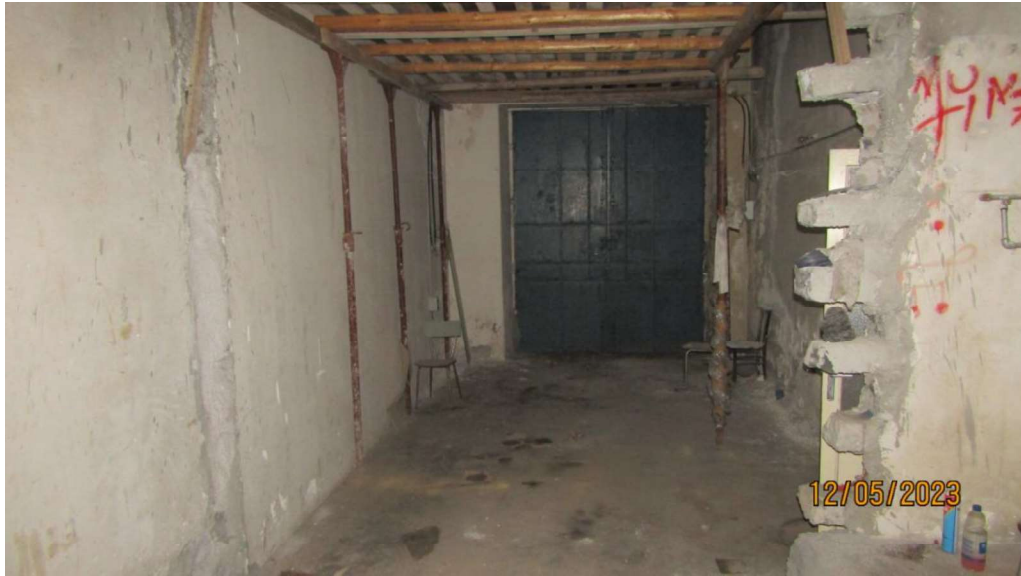
Fotografia nr. 24