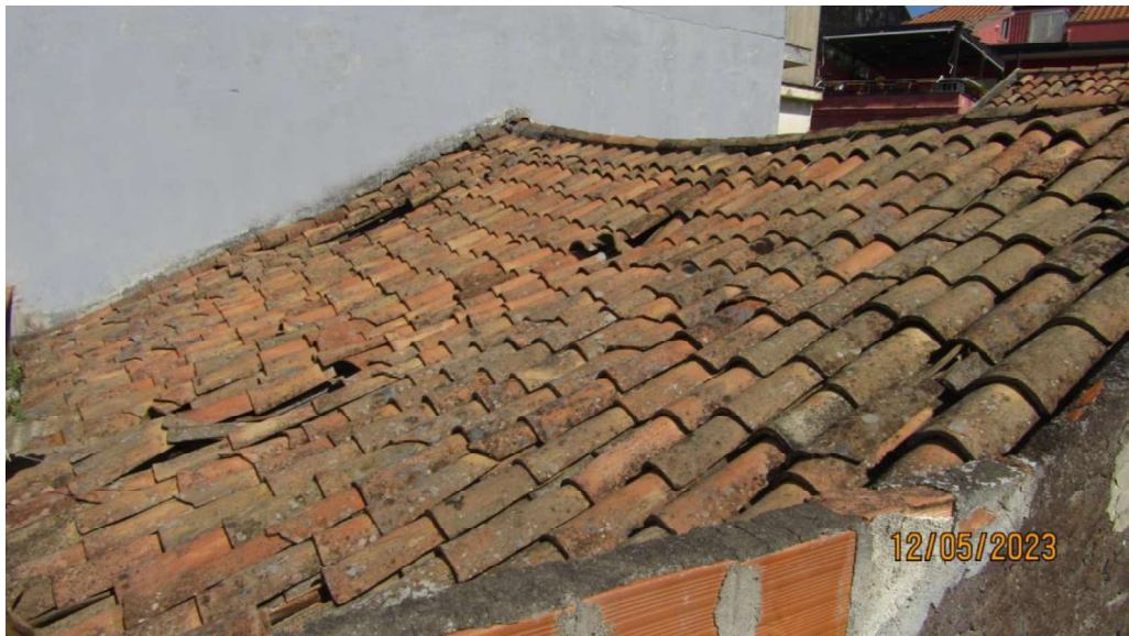
Fotografia nr. 17