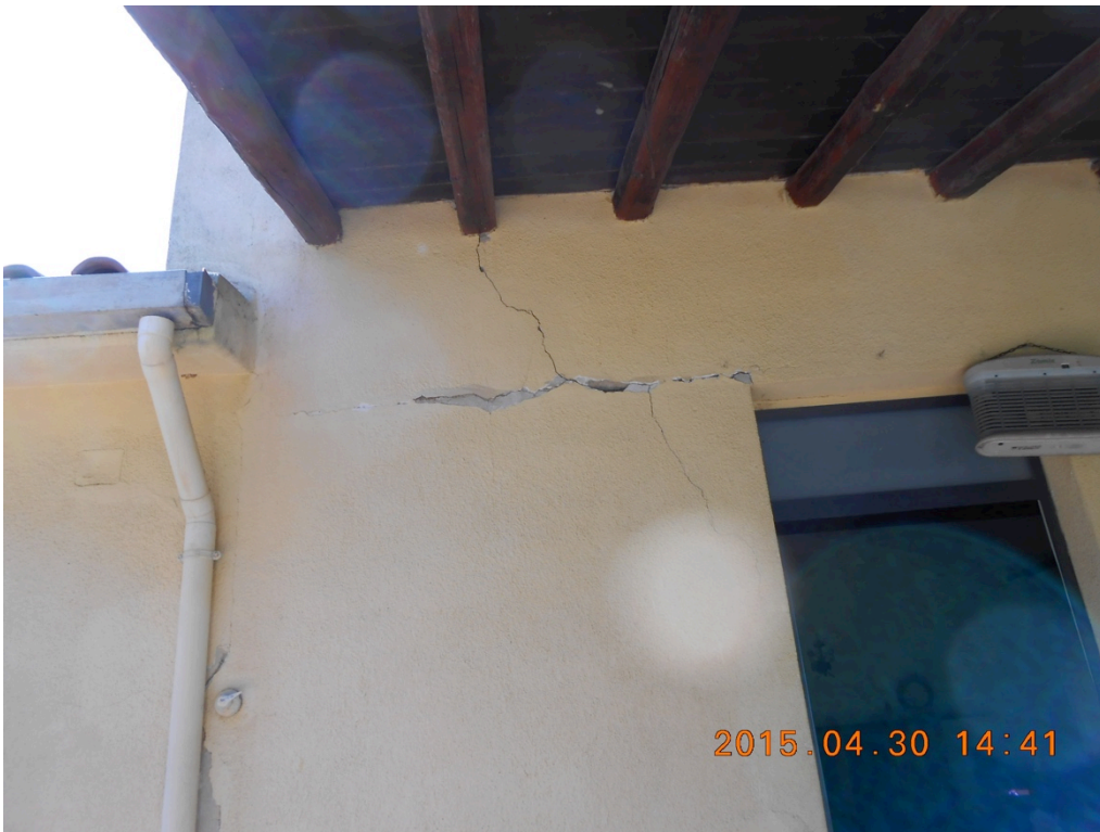
Foto n°8 – Immobile e lotto di C.da Stefano Barbadoro, Caltagirone (CT)_lesioni esterne