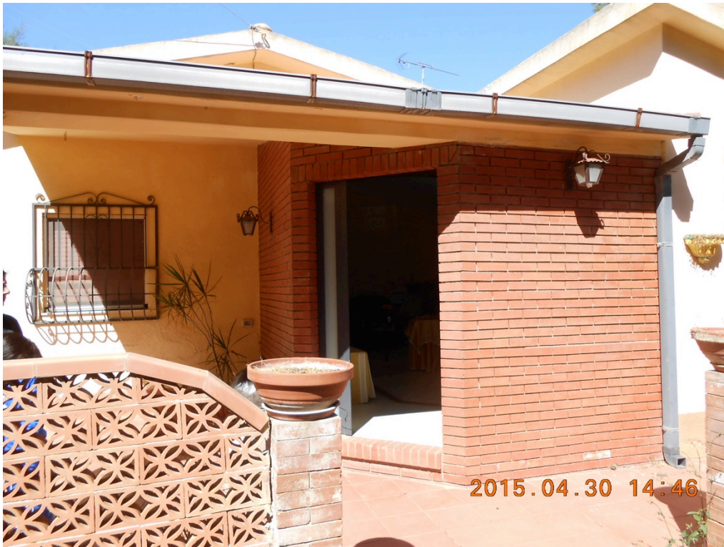
Foto n°5 – Immobile e lotto di C.da Stefano Barbadoro, Caltagirone (CT)_ Portico Ingresso abitazione