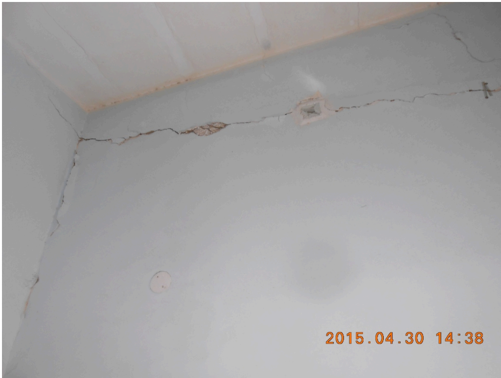
Foto n°9 – Immobile e lotto di C.da Stefano Barbadoro, Caltagirone (CT)_lesioni interne (camera da letto)