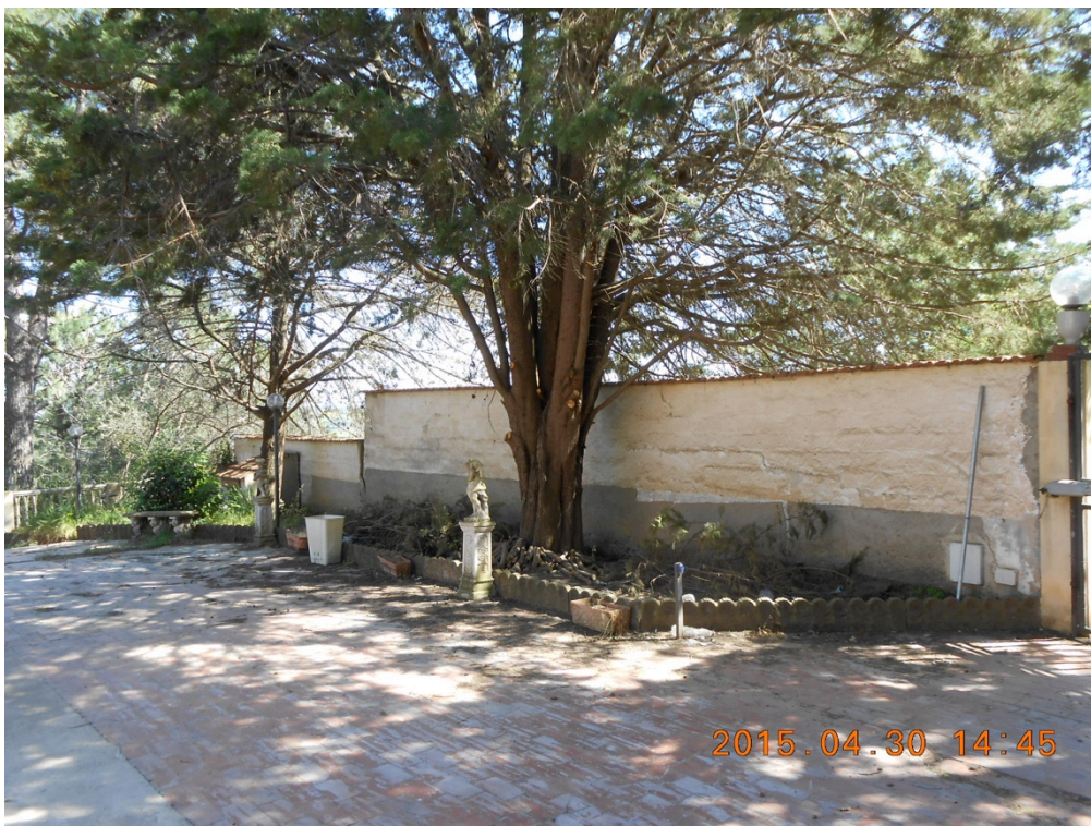
Foto n°2 – Immobile e lotto di C.da Stefano Barbadoro, Caltagirone (CT)_Vista esterna, (particolare pavimentazione)