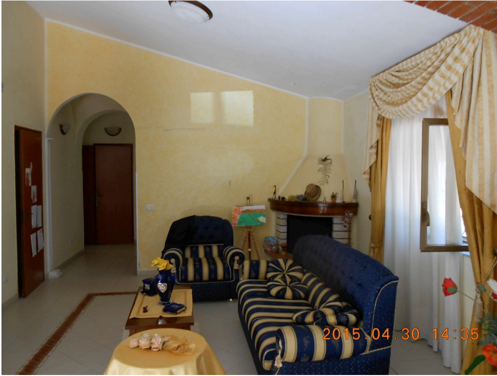
Foto n°7 – Immobile e lotto di C.da Stefano Barbadoro, Caltagirone (CT)_soggiorno