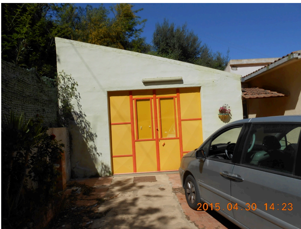
Foto n°4 – Immobile e lotto di C.da Stefano Barbadoro, Caltagirone (CT)_Ingresso garage