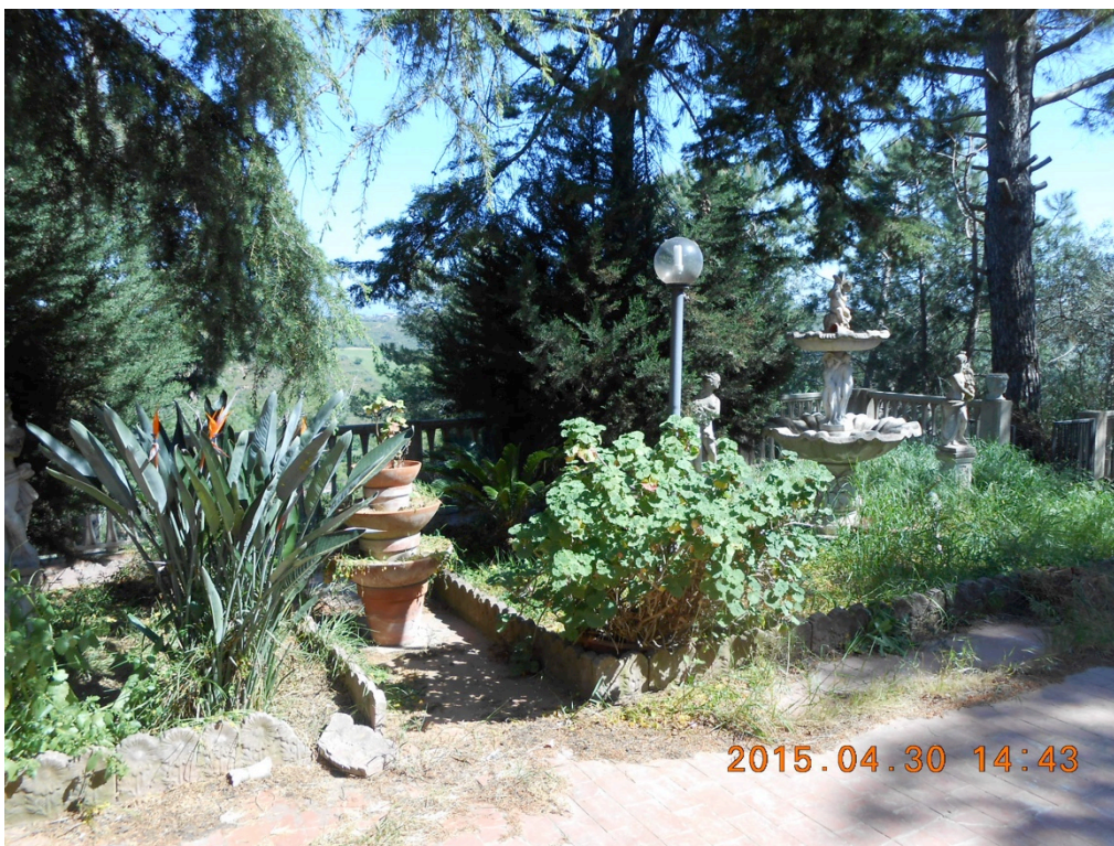
Foto n°3 – Immobile e lotto di C.da Stefano Barbadoro, Caltagirone (CT)_Cortile con giardino