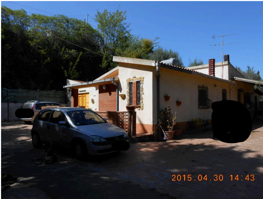
Foto n°1 – Immobile e lotto di C.da Stefano Barbadoro, Caltagirone (CT)_Vista esterna con la tettoia in legno sul lato Est