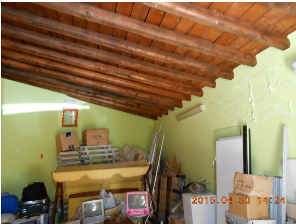
Foto n°6 – Immobile e lotto di C.da Stefano Barbadoro, Caltagirone (CT)_garage