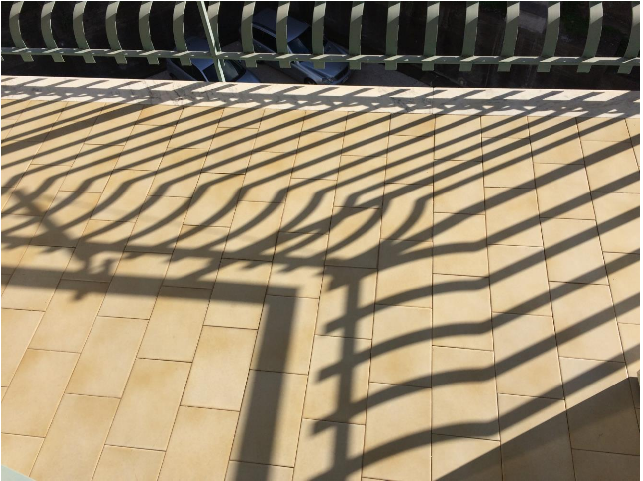
FO-18: Particolare pavimentazione e ringhiera balcone