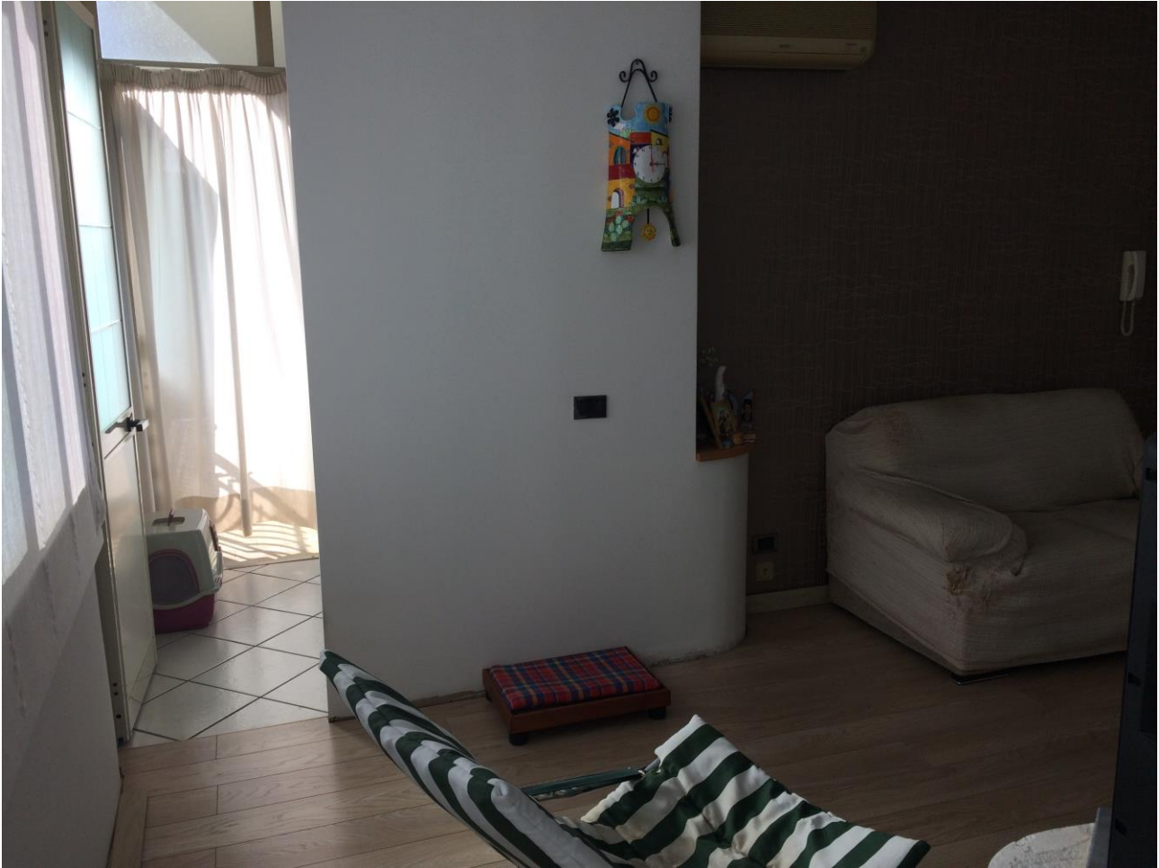
FO-15: Cucina con vista dell'uscita nella porzione restante di veranda destinata a lavanderia