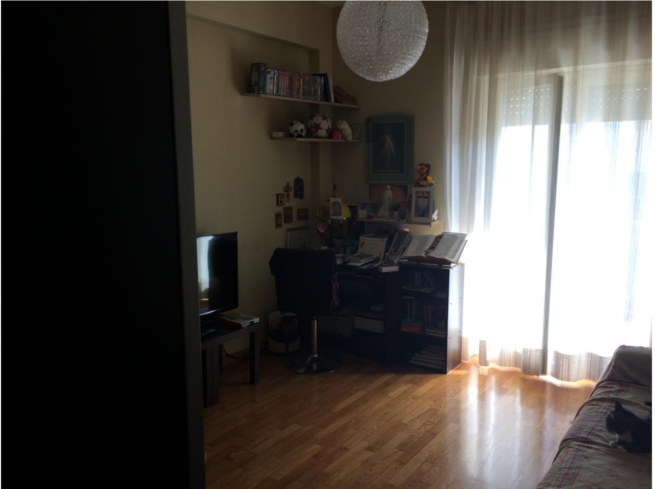
FO-11: Vano a est rispetto all'ingresso nel corridoio