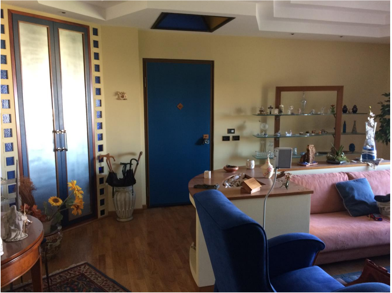
FO-9: Salone con vista portoncino d'ingresso