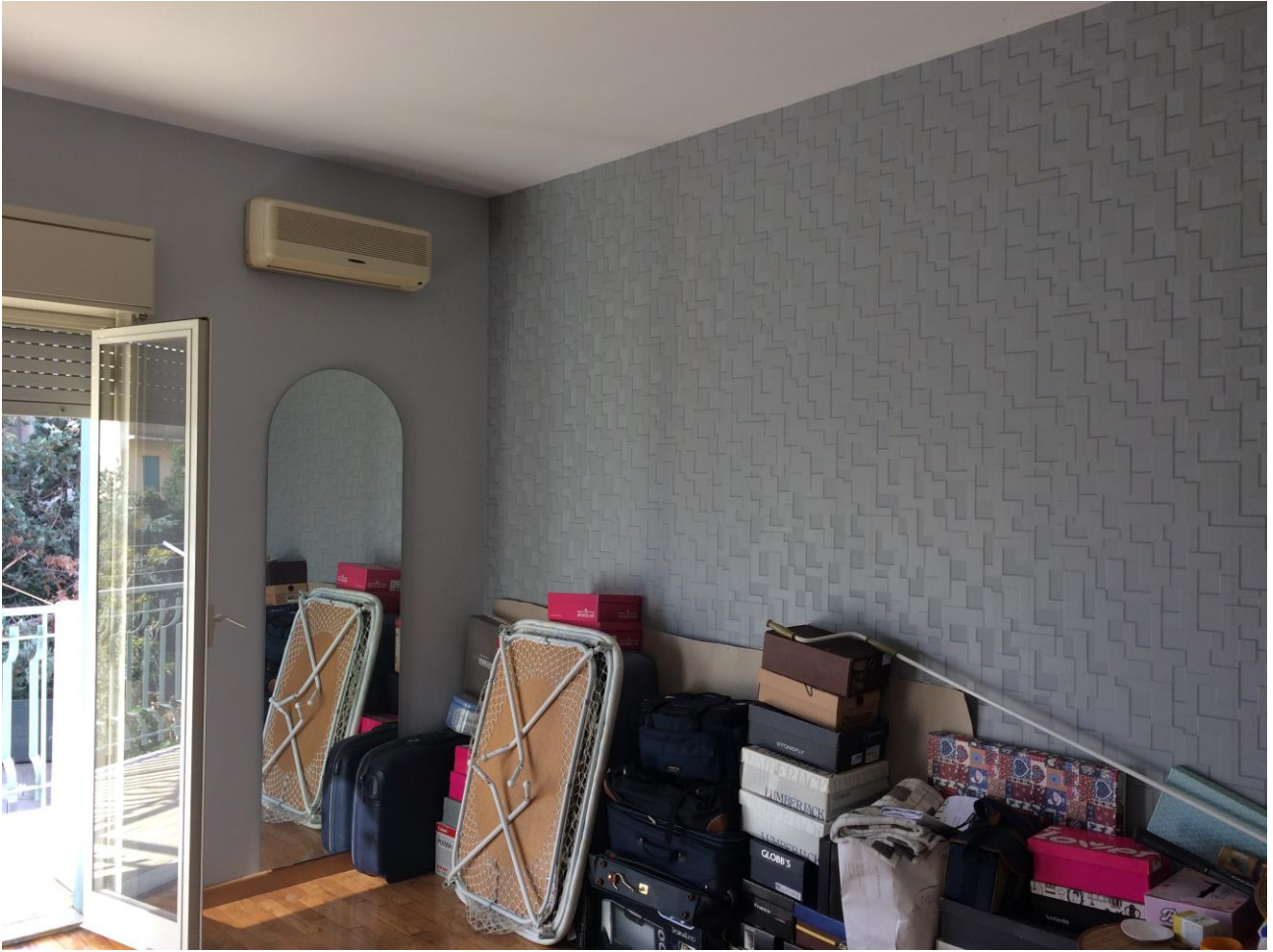
FO-12: Vano a ovest rispetto all'ingresso nel corridoio