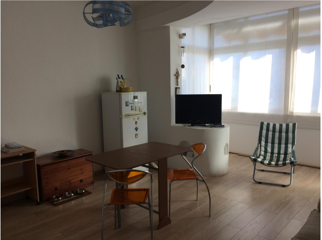
FO-14: Cucina con vista della porzione di balcone accorpata all'appartamento