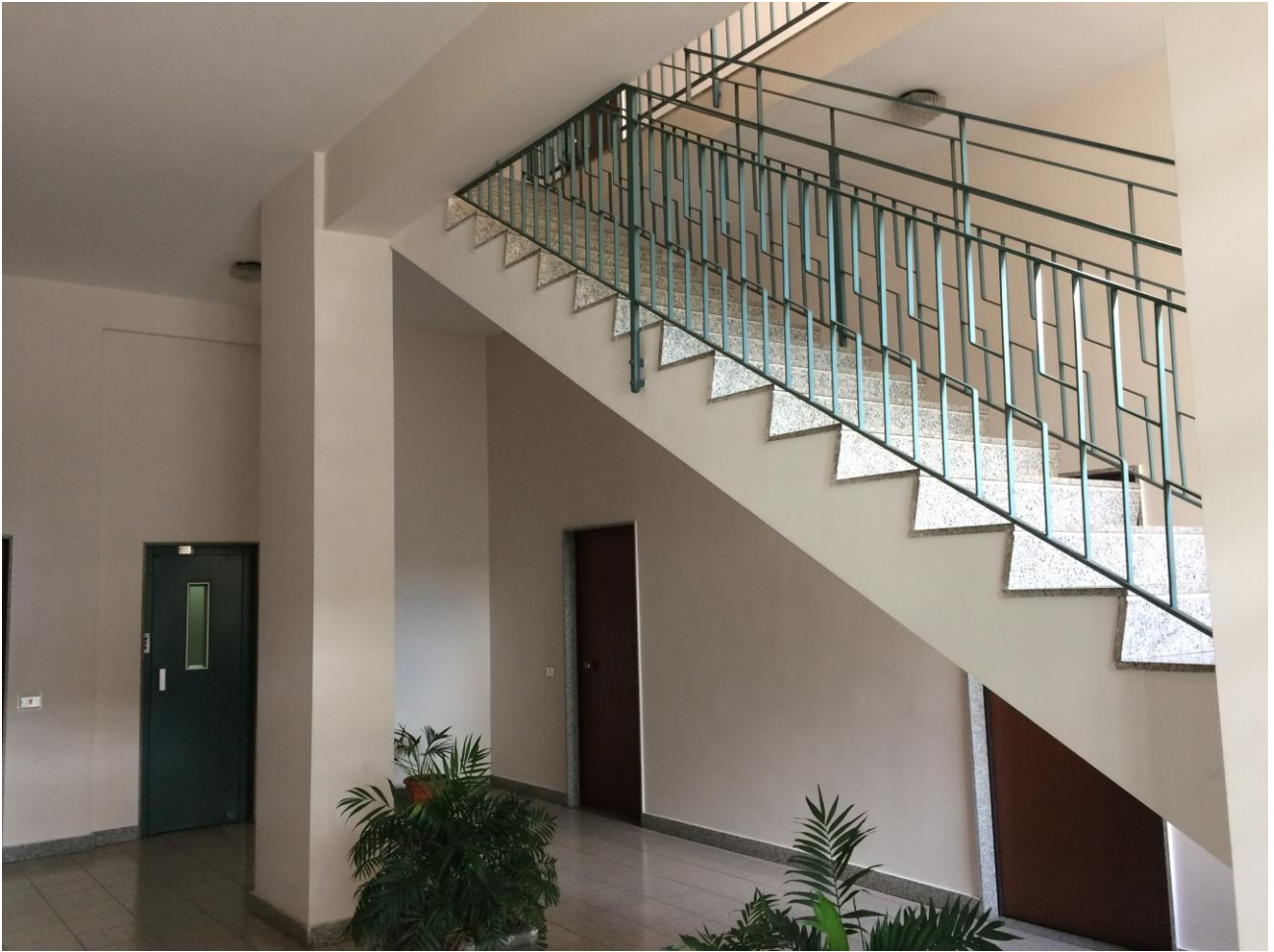
FO-5: Scala condominiale