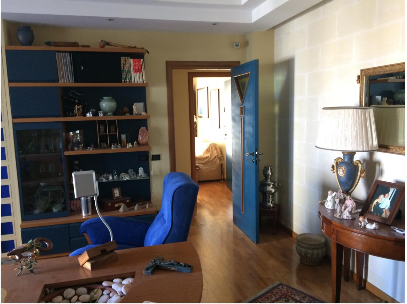
FO-8: Salone con vista porta di accesso al corridoio