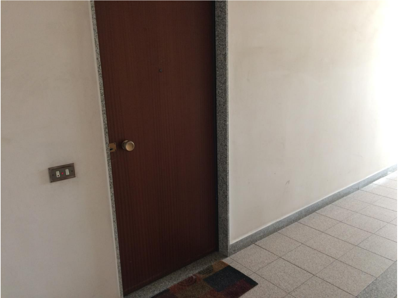
FO-7: Vista portoncino d'ingresso all'appartamento oggetto di pignoramento