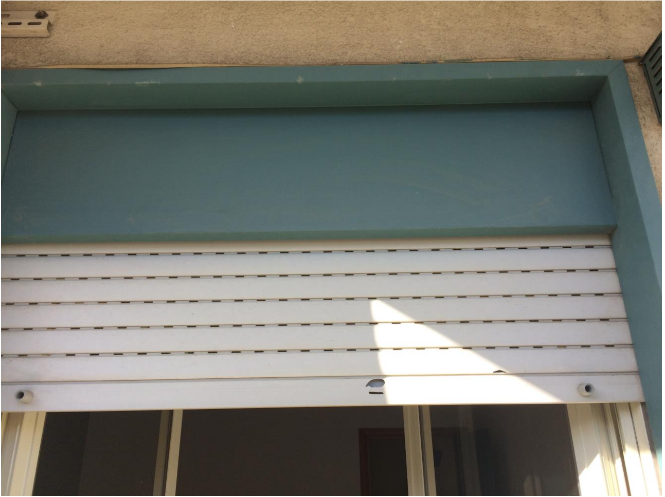
FO-20: Particolare infisso esterno