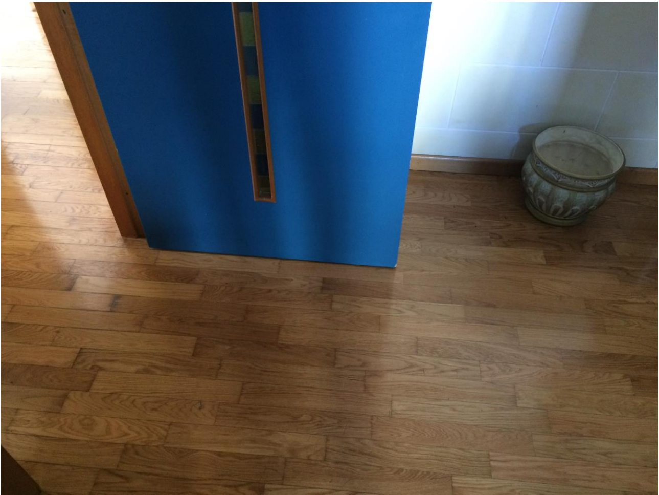
FO-19: Particolare porta interna e pavimentazione in parquet di legno