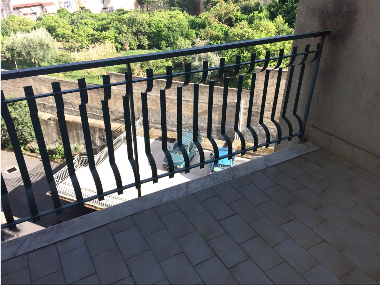
FO-10: Balcone esterno al salone