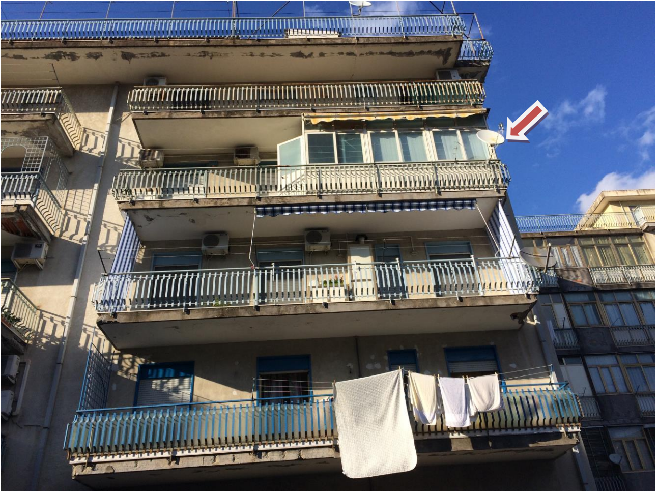
FO-2: Prospetto sud-ovest - Vista balcone, con veranda, appartamento oggetto di pignoramento