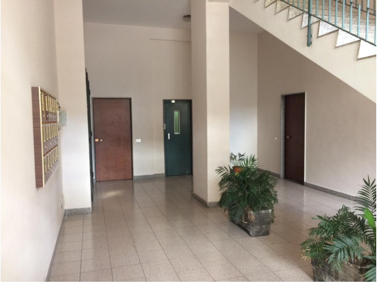
FO-4: Androne condominiale