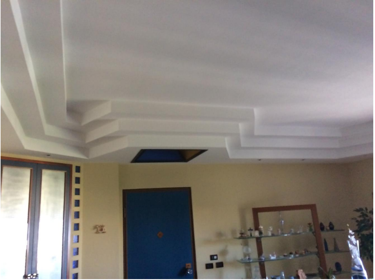
FO-21: Particolare controsoffitto in salone