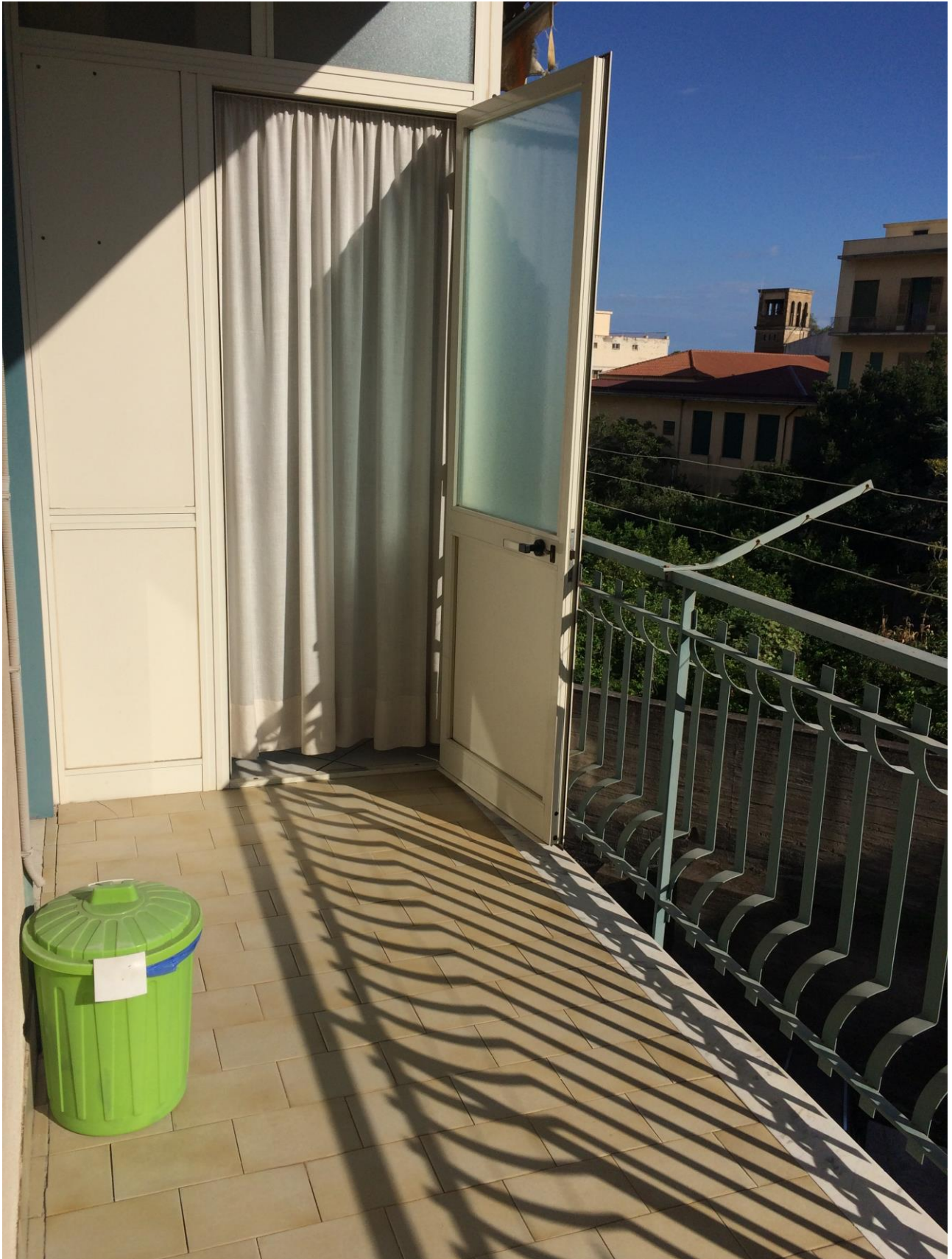
FO-17: Porzione di balcone sud-ovest con vista della veranda