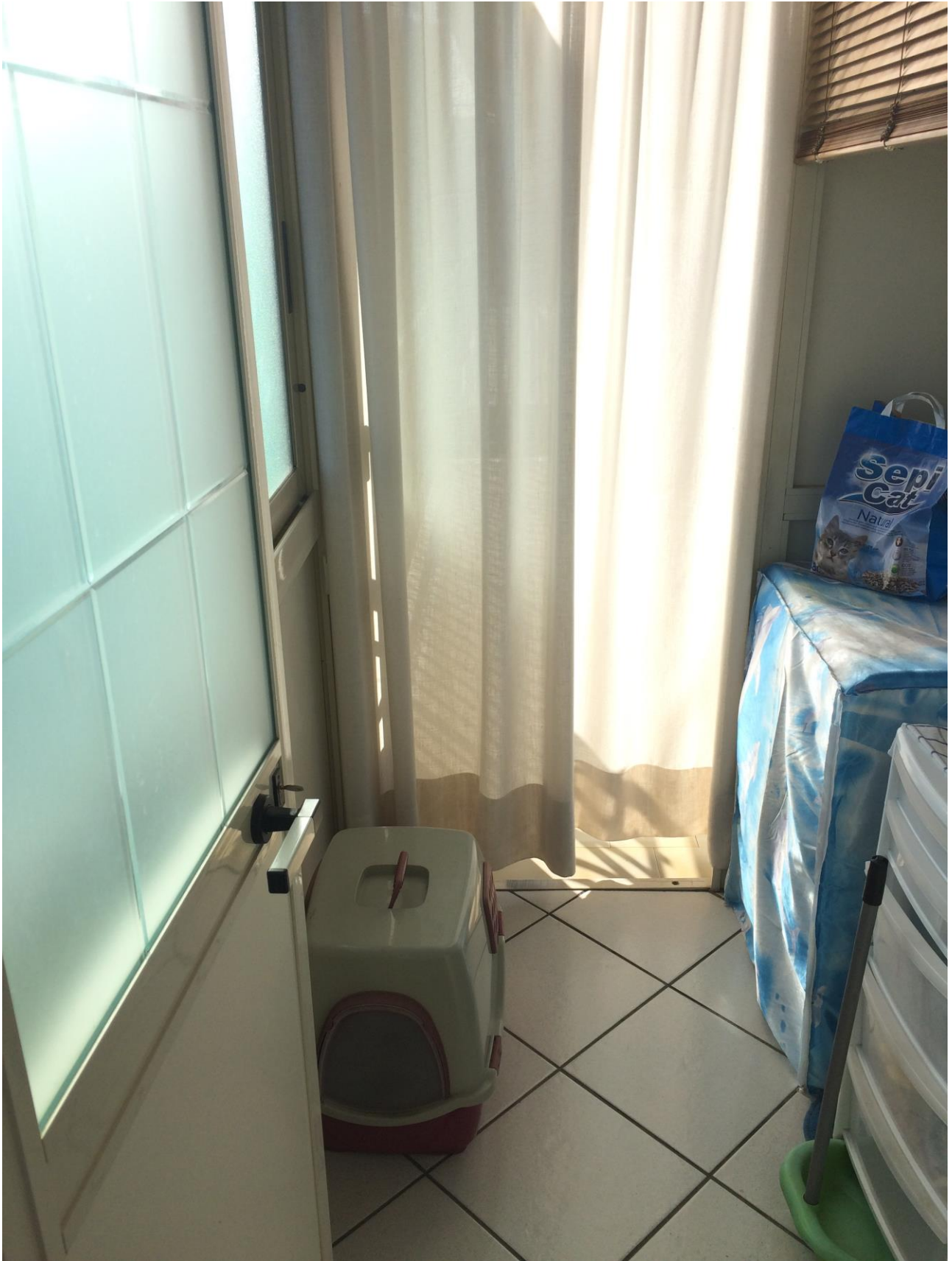
FO-16: Porzione di veranda adibita a lavanderia