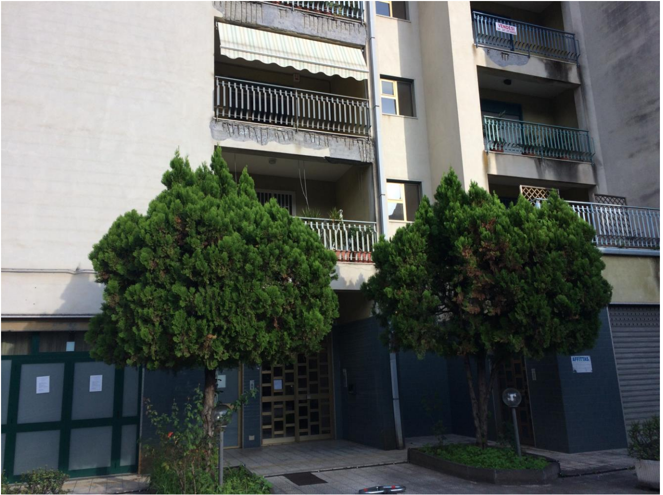
FO-1: Portone di ingresso civico 4/A della via Torquato Tasso