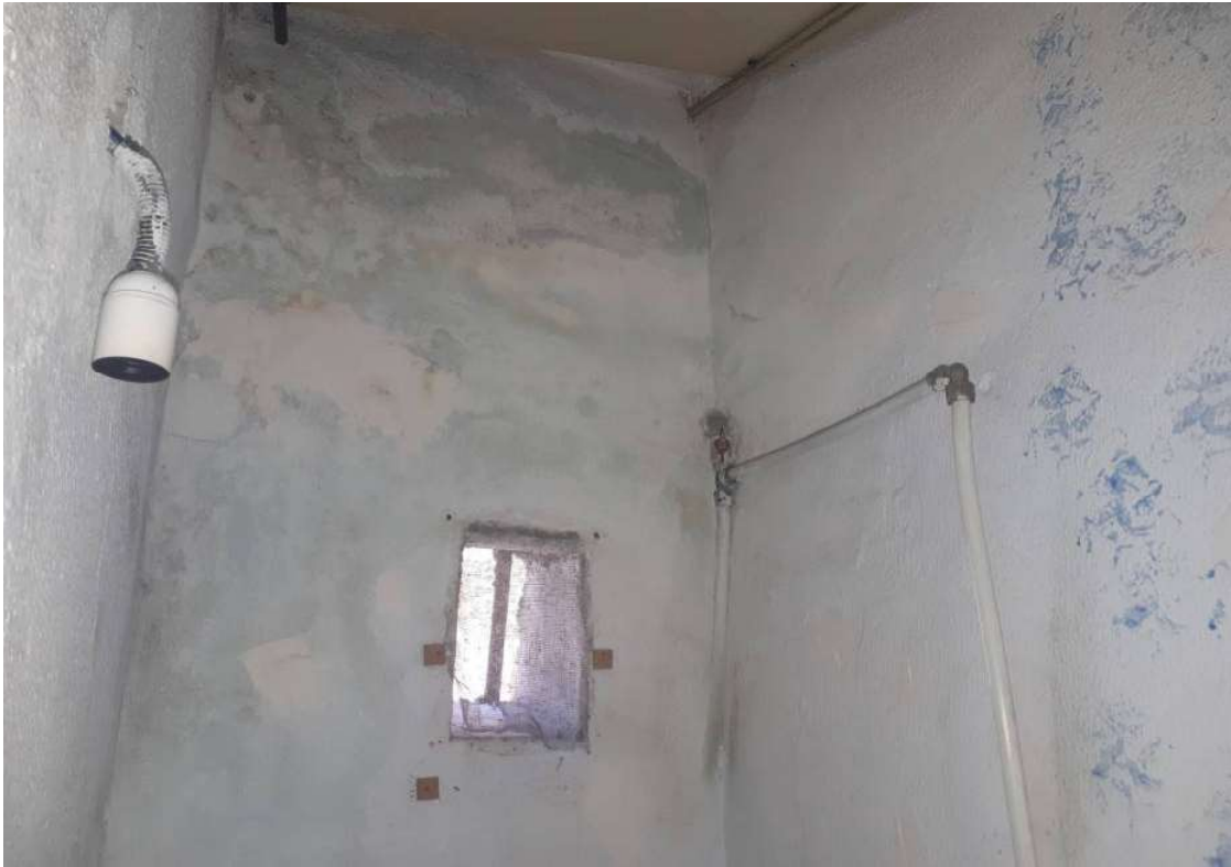
12. Vista WC - particolare degradi su pareti