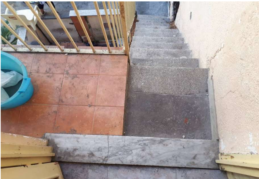
20. Vista su pianerottolo di ingresso