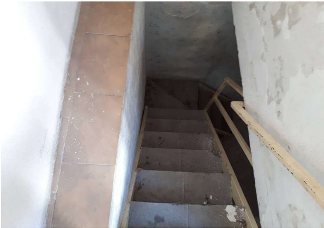
14. Vista da torrino verso scala interna