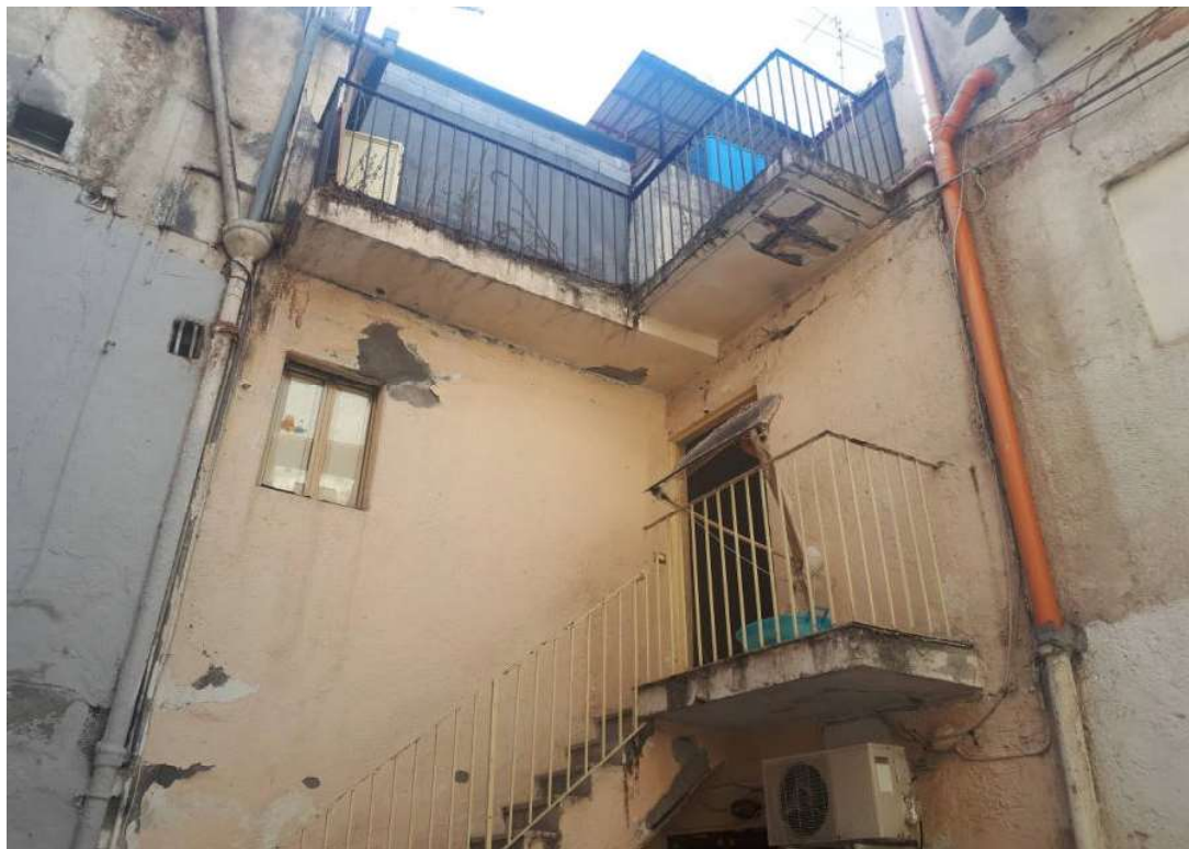
03. Vista dalla corte interna ingresso piano primo e affaccio terrazzo