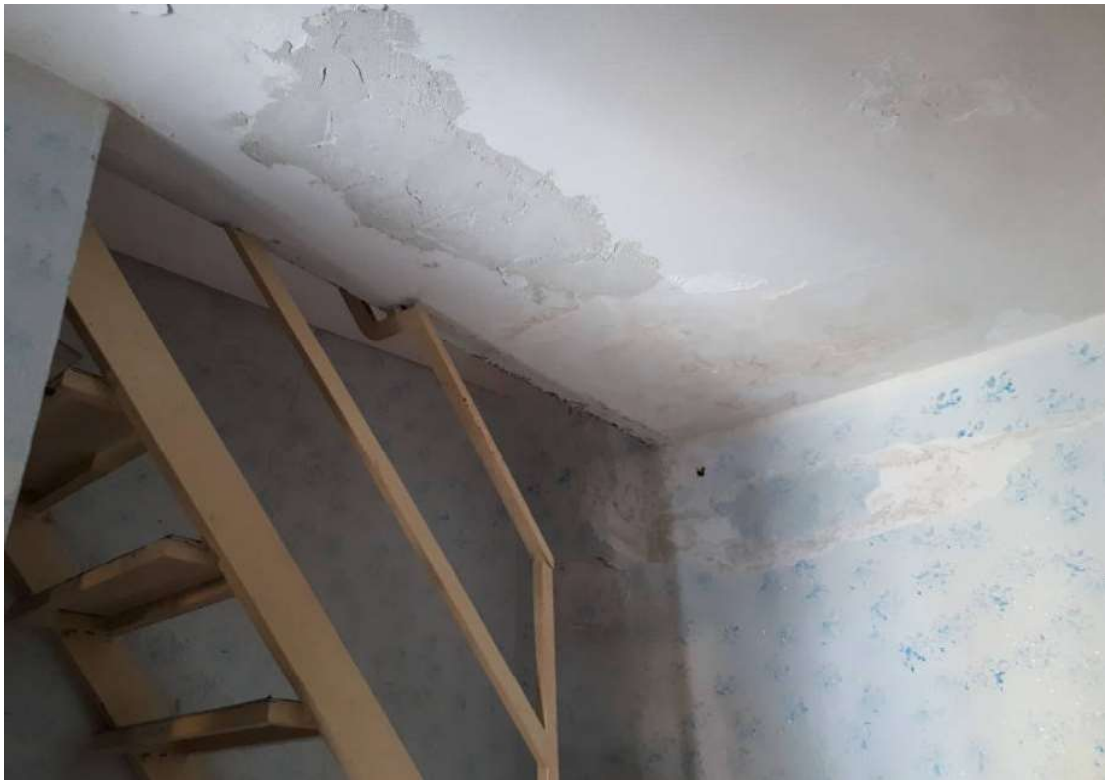
13. Vista interna – particolare degradi su pareti e soffitto