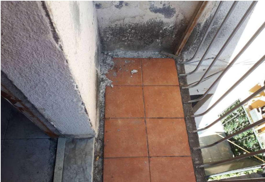
19. Vista esterna - particolare balcone piano secondo