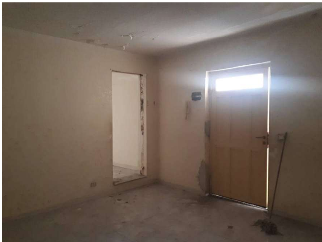
07. Vista sulla porta di ingresso