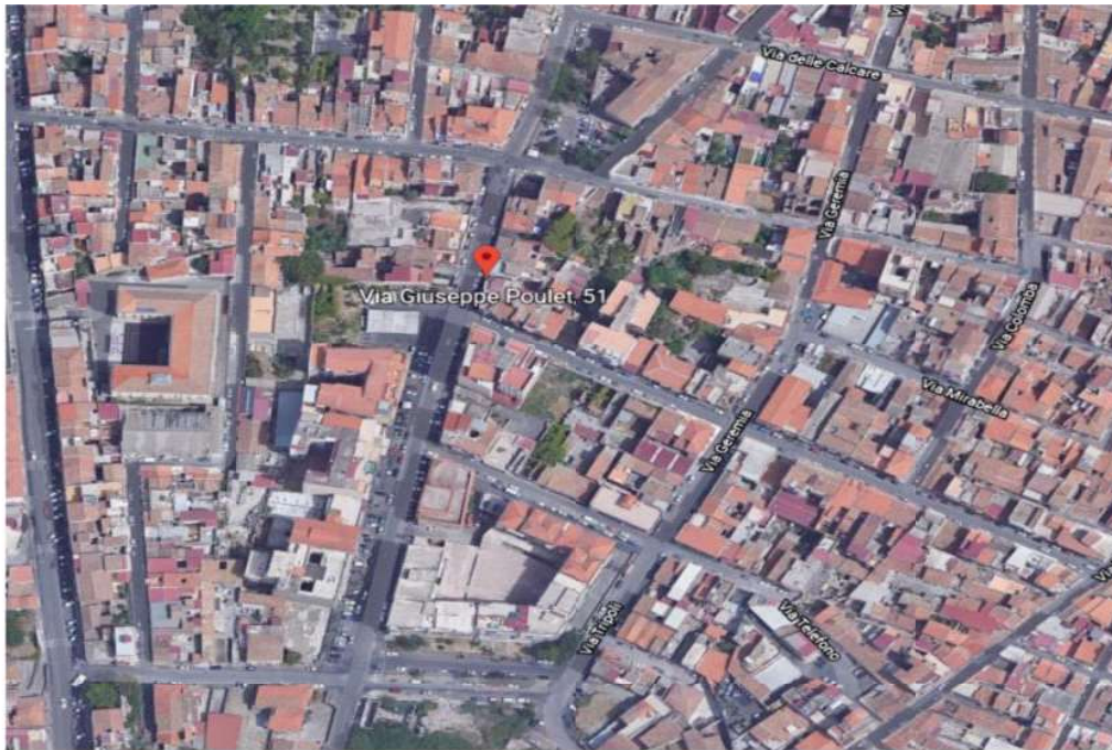
Vista satellitare (Google Maps)