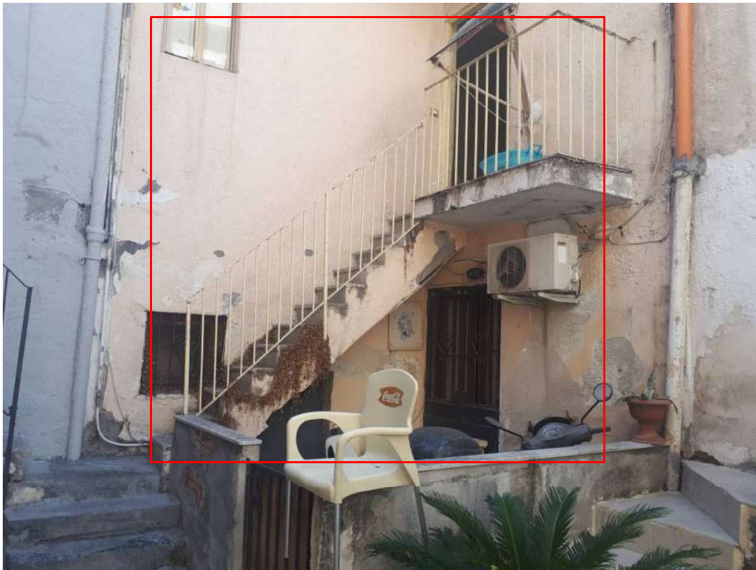
02. Vista interna alla corte. Ingresso 23 (ex sub 9)