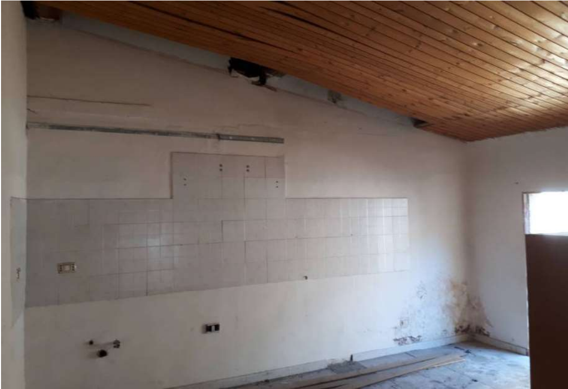
18. Vista interna vano piano secondo