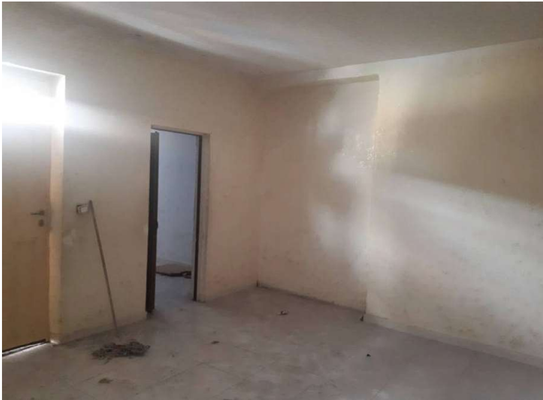
09. Vista interna verso vano con scala