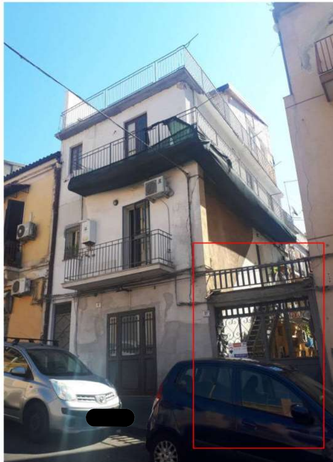
01. Vista dell'ingresso condominiale su via G. Poulet