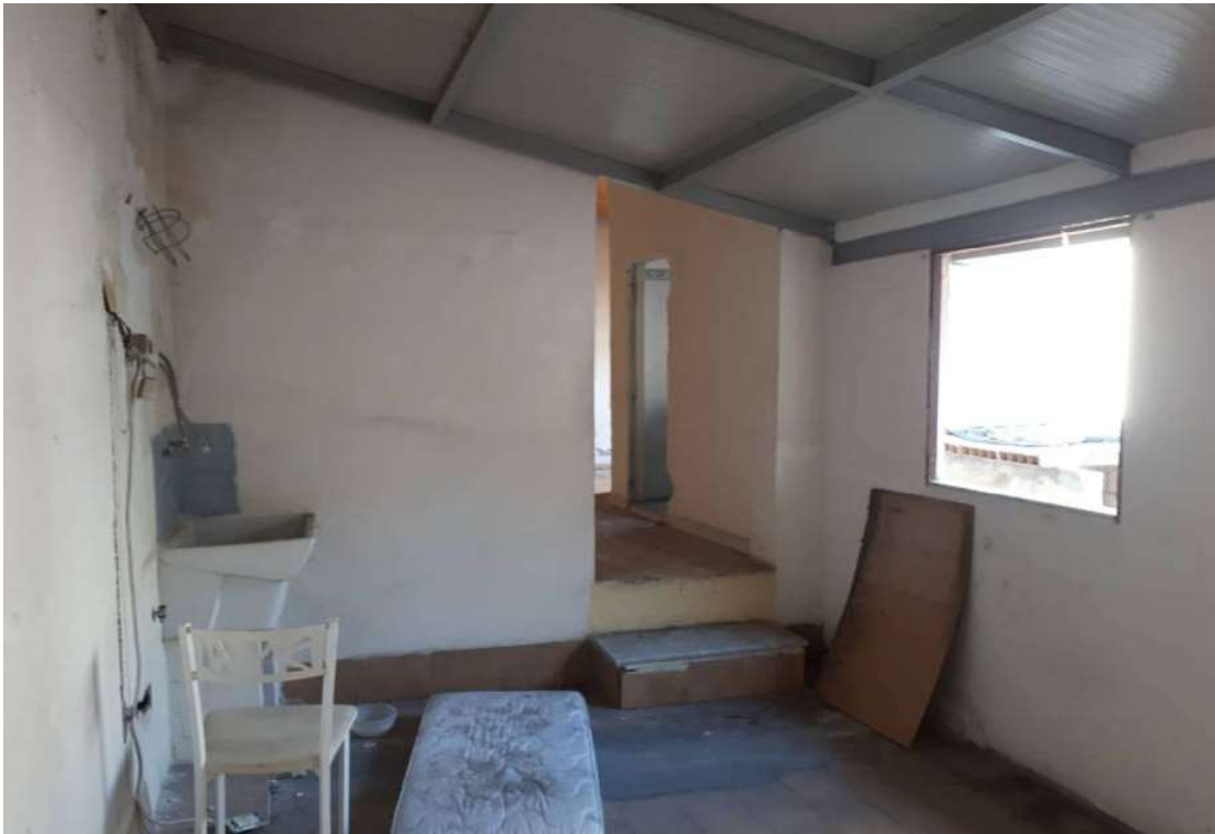
16. Vista interna secondo piano vano aggiunto