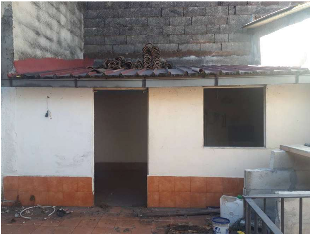
04. Vista dalla terrazza – volume aggiunto