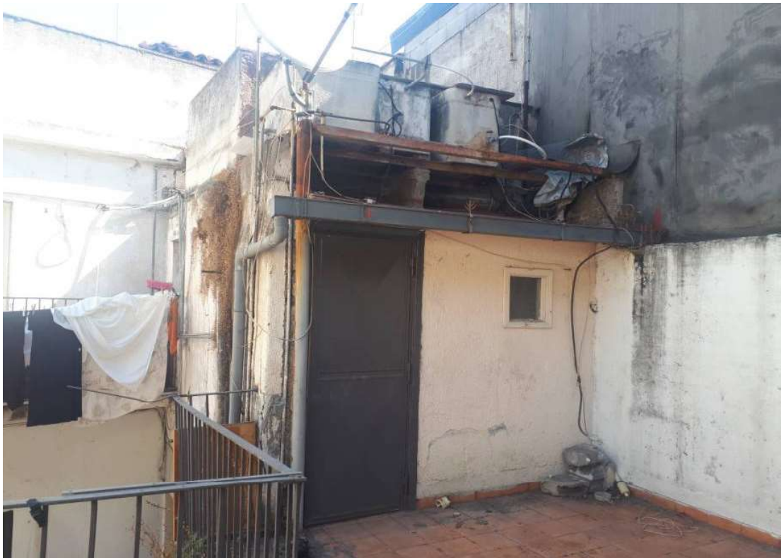
15. Vista da terrazza verso torrino scala