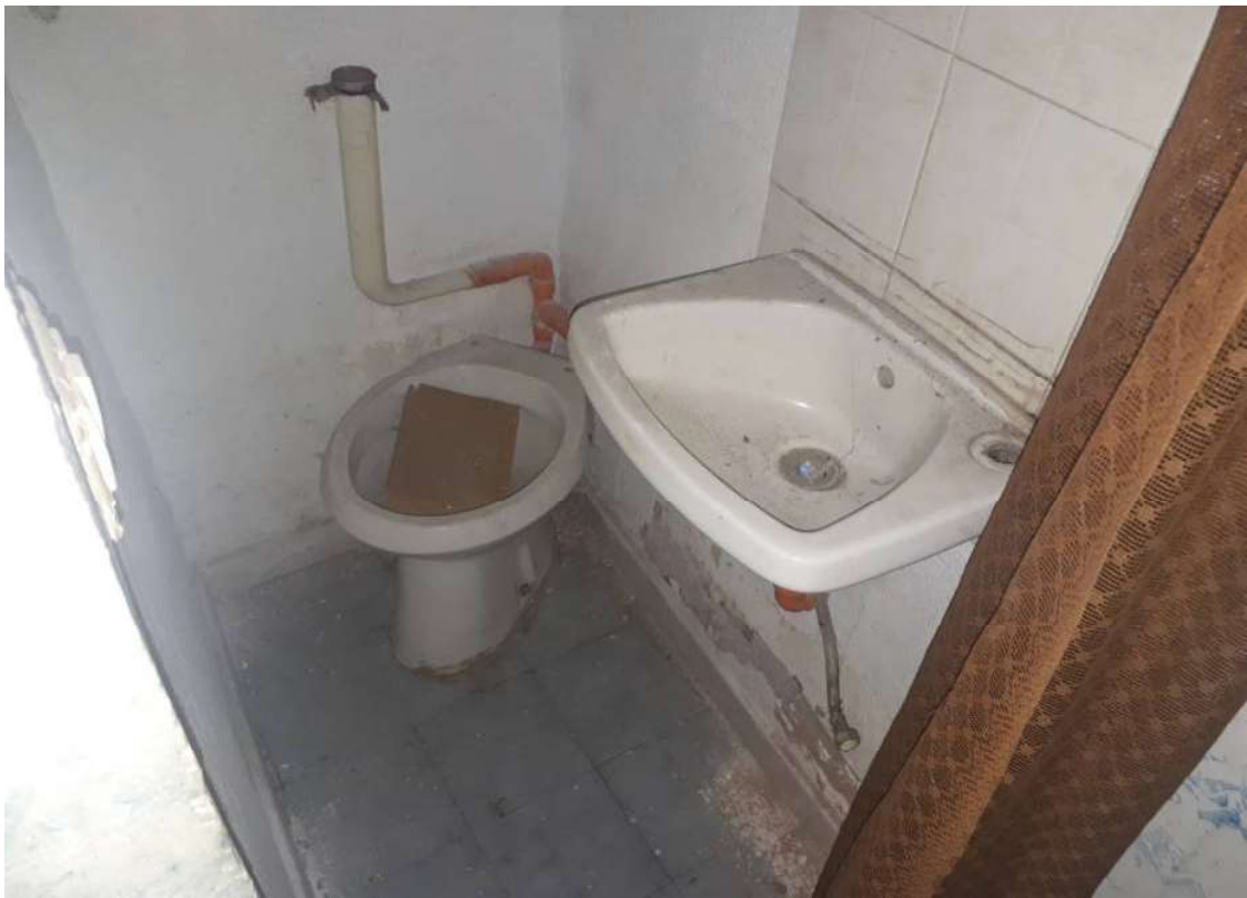
11. Particolare WC sottoscala