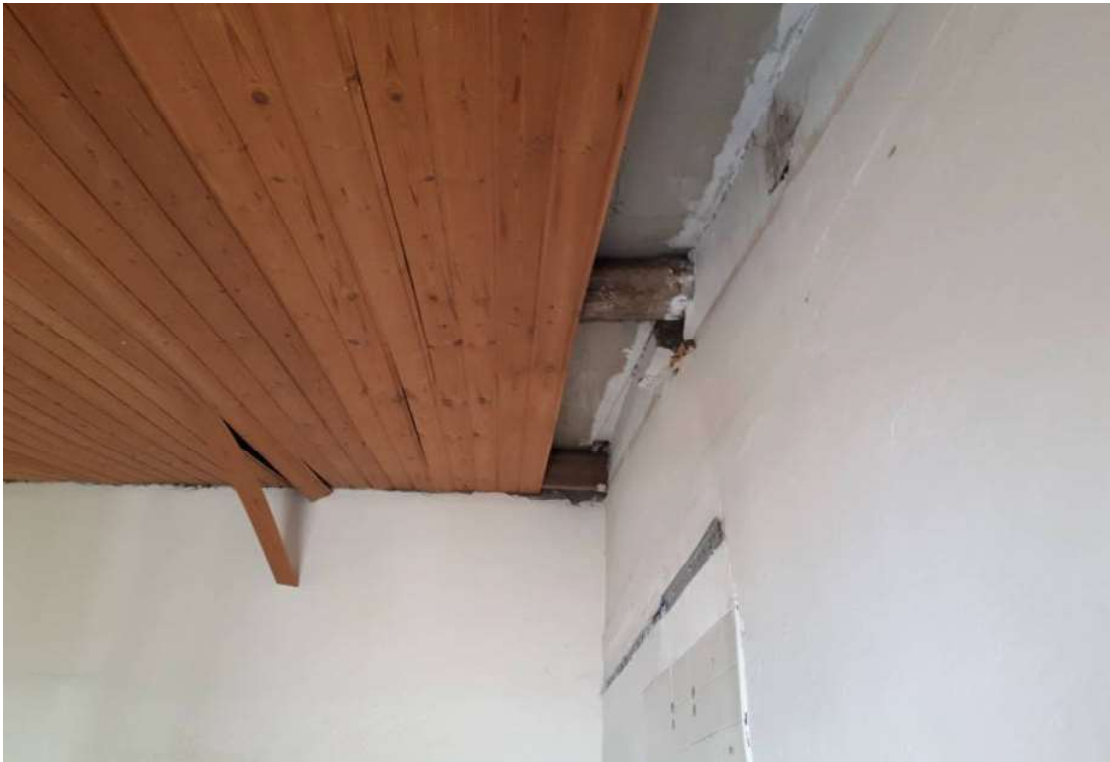
17. Vista particolare copertura vano piano secondo