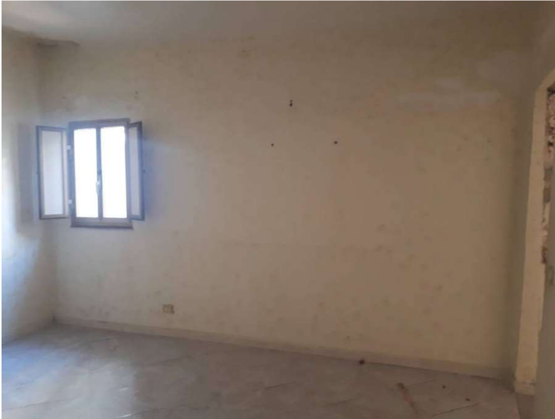
08. Vista interna (ex sub. 9)