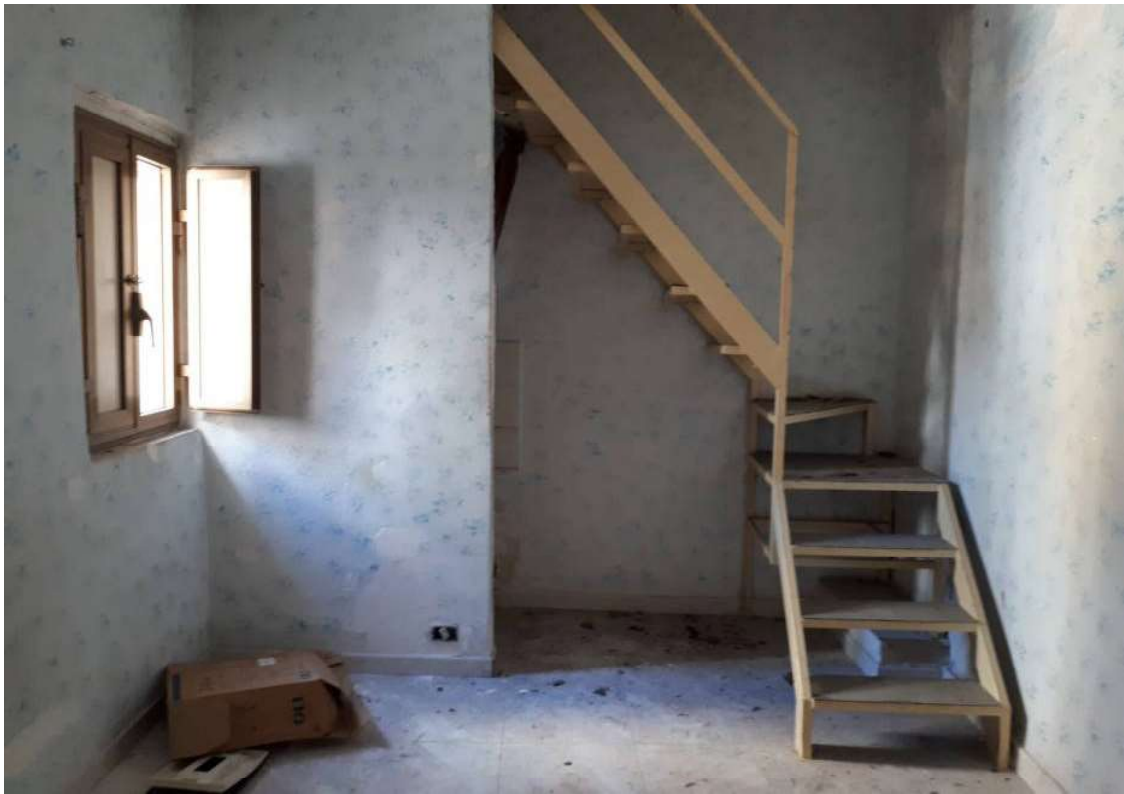
10. Vista interna verso scala