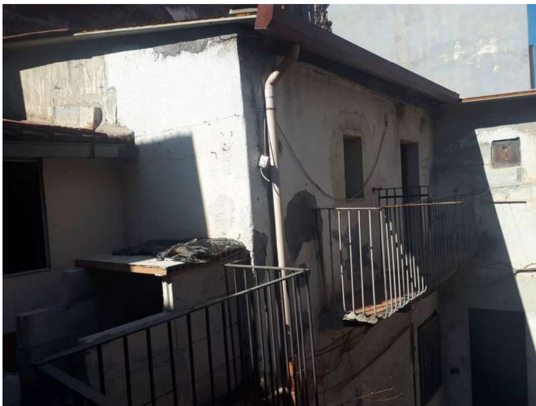
06. Vista dalla terrazza verso il balcone WC-ripostiglio