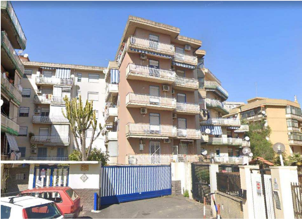
FO - 1: Vista ingresso carrabile da Via Balilla 2