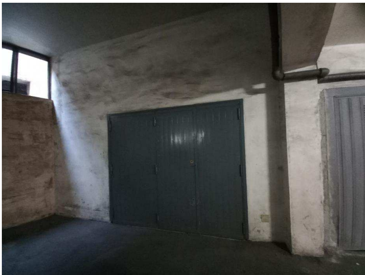
FO - 5: Vista accesso garage