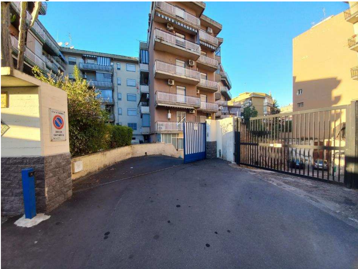
FO - 2: Vista ingresso carrabile verso corsia condominiale