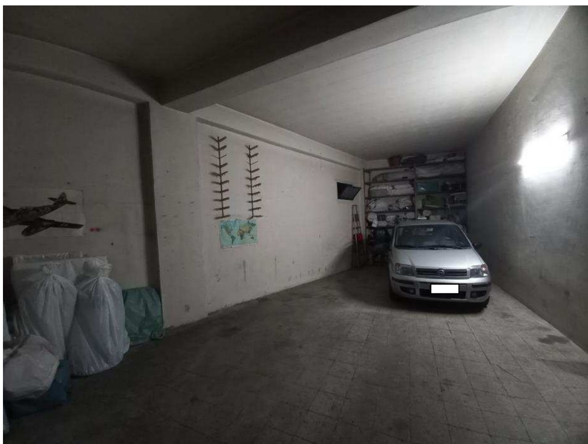
FO - 6: Vista interno garage