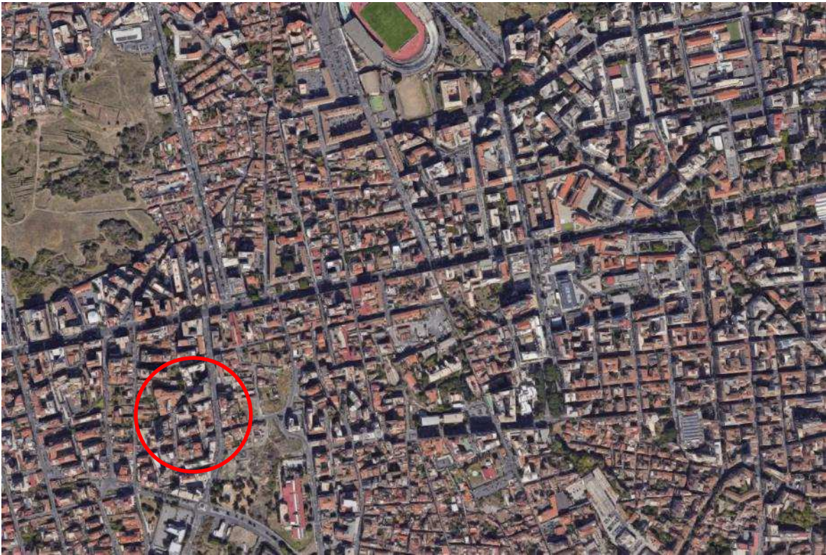
Immagine 1: Foto aerea del tessuto urbano in cui ricade l'immobile pignorato