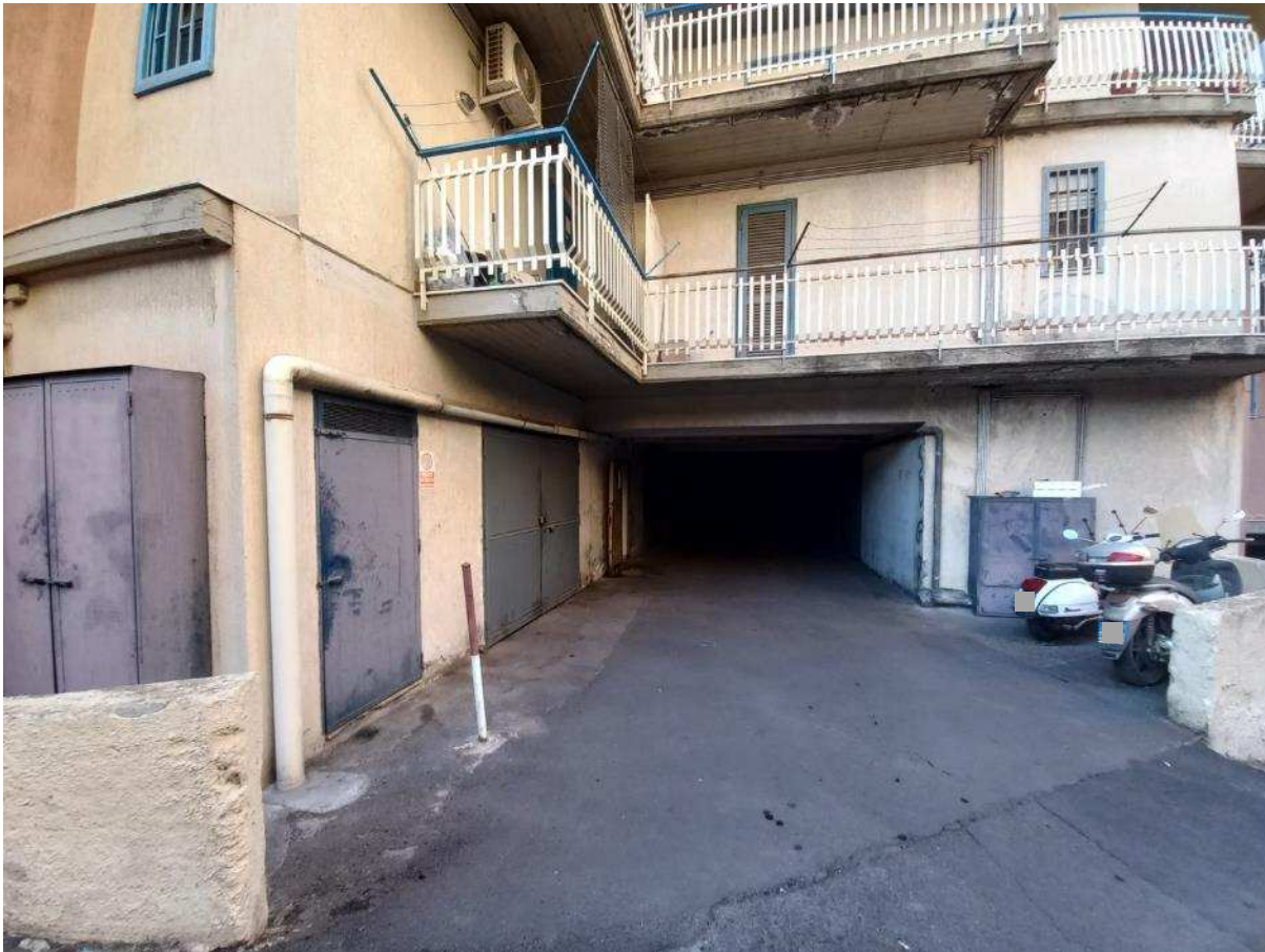
FO - 3: Corsia condominiale a cielo scoperto