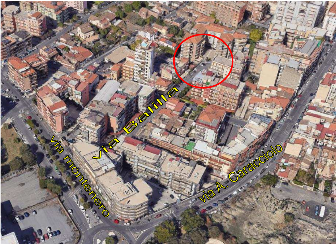
Immagine 2: Individuazione della via Balilla e dell'edificio in cui ricade l'immobile pignorato