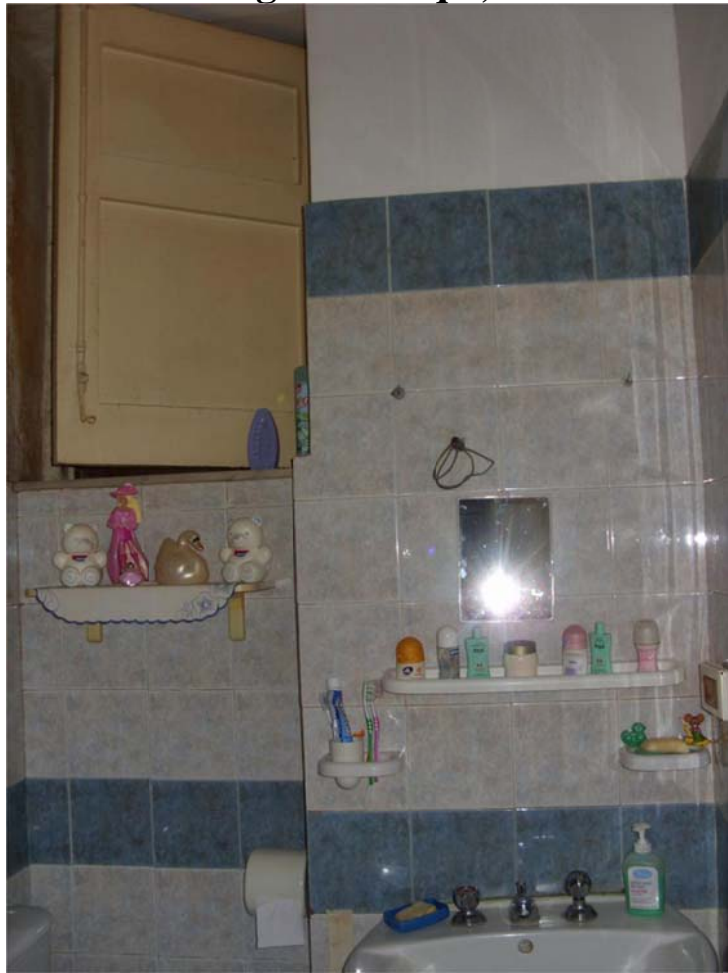
Lavanderia da mq 1,90