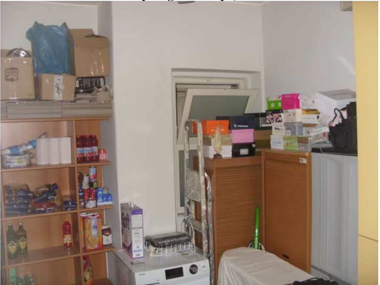
Macchie da infiltrazioni d'acqua discendenti