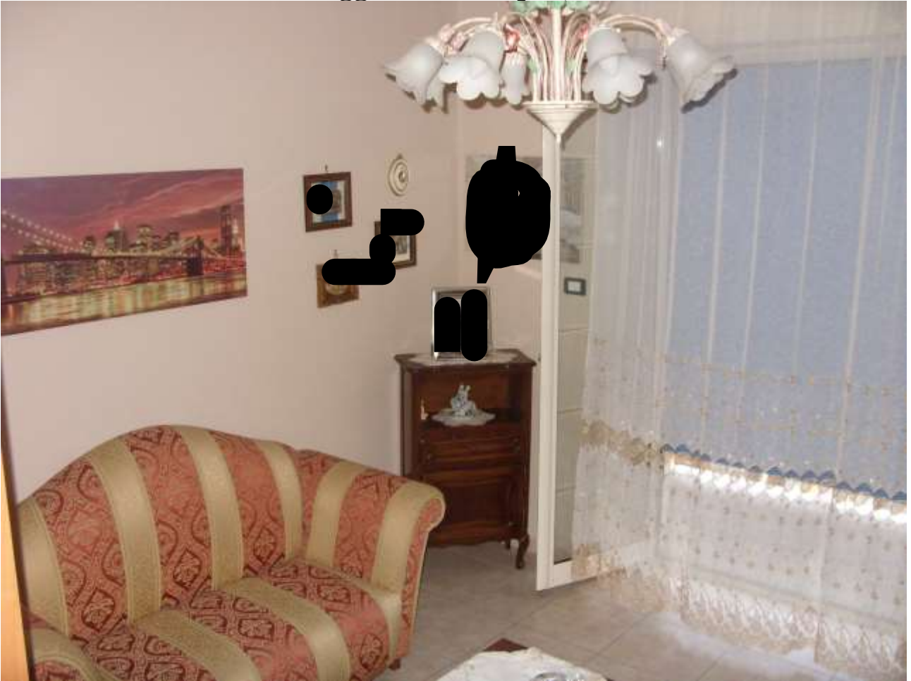
Camera da letto 1 da mq 18,50