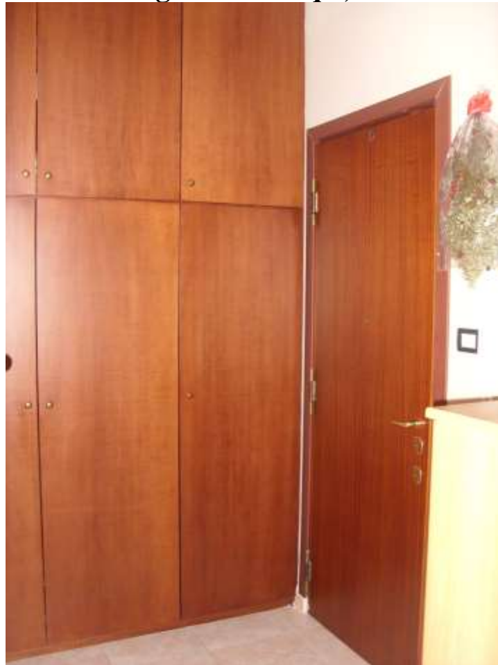
Camera da letto da mq 15,60