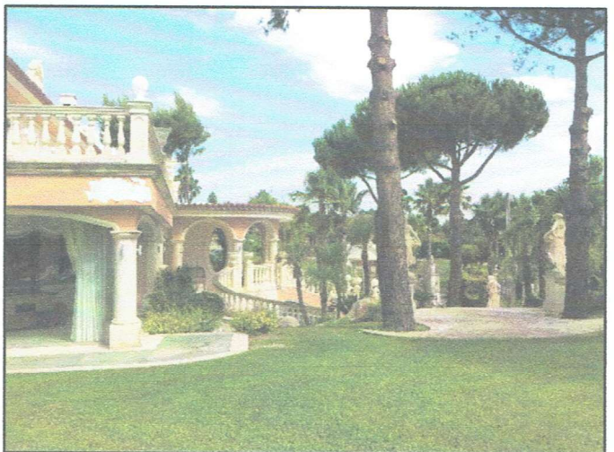
Foto n° 9 - PART. PROSPETTO LATO SUD/OVEST Foto n° 10 - PART. GIARDINO LATO SUD/OVEST