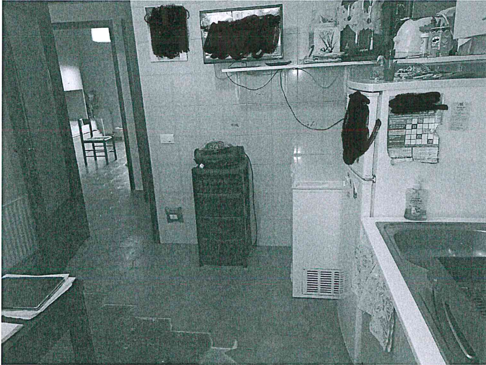
FOTO N. 10-11 Locale Cucina