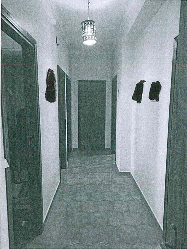
FOTO N. 8-9 Corridoio distributivo