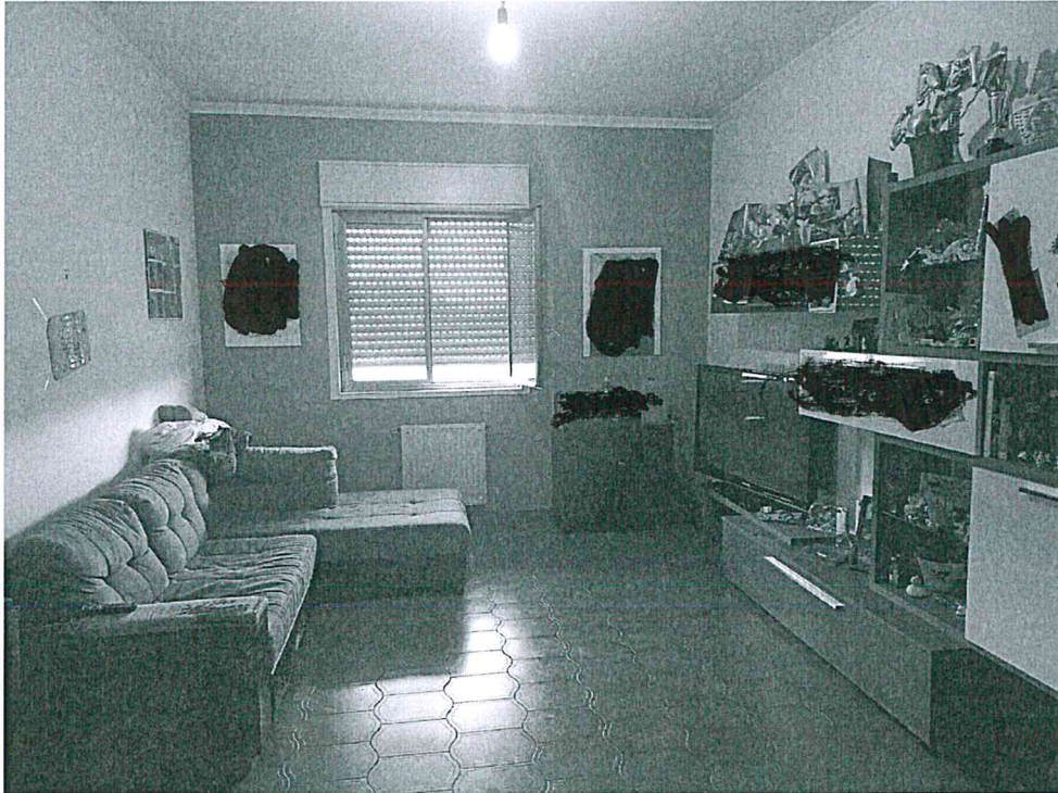
FOTO N. 6-7 Locale Salone