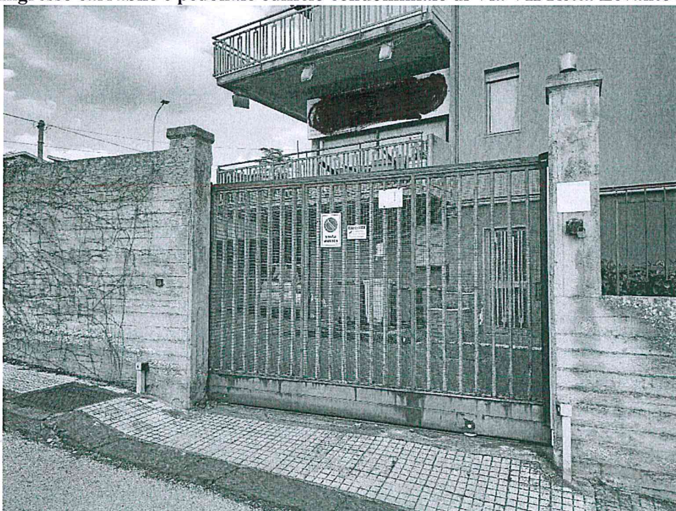
FOTO N. 1-2 Ingresso carrabile e pedonale edificio condominiale di Via VII Retta Levante n. 60 Belpasso